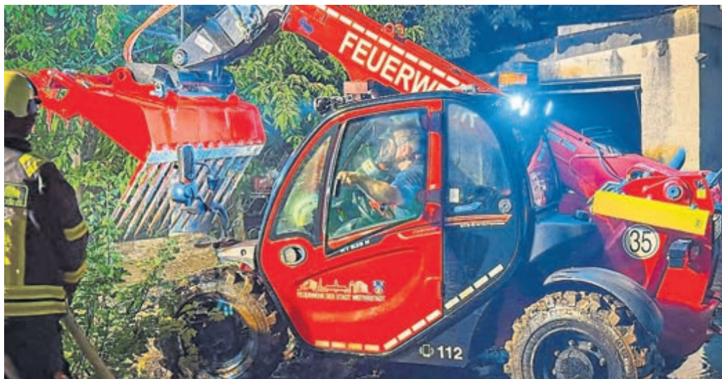
Rüsselsheim (red). In der Nacht auf Dienstag, den 9. Juni, wurde die Feuerwehr der Stadt Weiterstadt um 00.30 Uhr mit dem Abrollbehälter-Teleskopplader zur Unterstützung bei einem Großbrand auf einem landwirtschaftlichen Betrieb in Rüsselsheim-Königstädten gerufen. Die Einsatzkräfte unterstützten vor Ort die laufenden Nachlöscharbeiten. Mit dem Teleskopplader wurde unter anderem brennendes Stroh aus einer Scheune entfernt, um versteckte Glutnester freizulegen und gezielt ablöschen zu können. Nach mehreren Stunden im Einsatz konnte die Unterstützung durch die Feuerwehr der Stadt Weiterstadt gegen 7.30 Uhr beendet werden.

Weiterstädter Wehr hilft bei Großbrand in Rüsselsheim