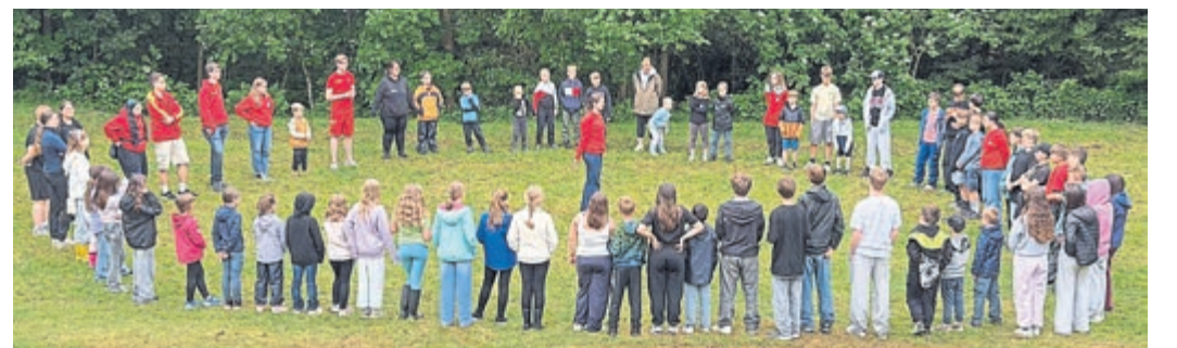
Gemeinsam geplant, gemeinsam ausgeführt. Ob sportliche Wettkämpfe, Spiele oder einfach am Lagerfeuer zusammen sitzen, singen und Marshmallows rösten: Beim Zeltlager der DLRG hatten alle jede Menge Spaß und das Miteinander ist gelungen.

regnerischen Wetters ließen sich die Teilnehmenden die gute Laune nicht verderben. Bei verschiedenen Kennenlernspielen hatten die Kinder die Möglichkeit, schnell neue Freundschaften zu knüpfen und als Gruppe zusammenzuwachsen. Anschließend wurde der Zeltplatz erkundet und bei verschiedenen Outdoor-Aktivitäten konnten sich alle austoben. Am Abend versammelten sich alle am Lagerfeuer, wo der Tag in gemütlicher Atmosphäre ausklang.