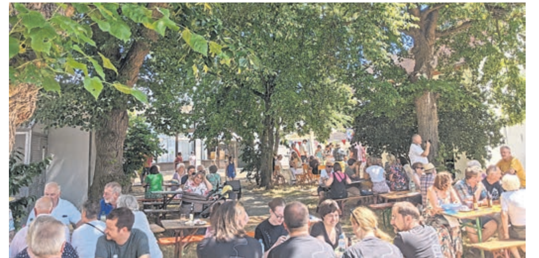
Für das Ökumenische Fest der Gemeinden werden in diesem Jahr noch helfende Hände gesucht, damit alle wieder wie auf dem Foto aus dem Jahr 2023 gemeinsam einen schönen Tag erleben können.

Weiterstadt (red/ml). Das Ökumenische Fest der Gemeinden am Sonntag, dem 21. Juni, rund um die katholische Kirche in Weiterstadt steht vor der Tür, und damit es ein unvergesslicher Tag für alle wird, brauchen die Gemeinden noch helfende Hände: Ob am Grill, an der Kuchentheke, am Salatbuffet oder den Getränken. Jeder Einsatz zählt. Um es so einfach wie möglich zu machen, hat Maria Lorenz von der katholischen Gemeinde einen Link für eine Tabelle erstellt: „Einfach in das Feld für die passende Uhrzeit klicken und