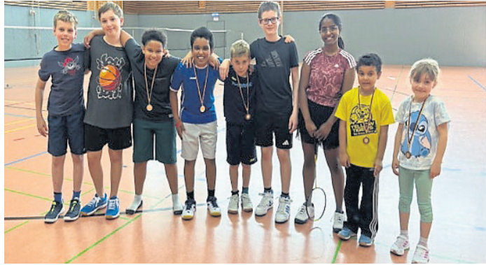
Die Mini-Schüler im Badminton (links) und die Erwachsenen hatten viel Spaß bei den Vereinsmeisterschaften der SG Weiterstadt, auch wenn sie alle Spiele an einem Tag absolvieren mussten.

Badminton: Vereinsmeisterschaft bei der SGW in drei Disziplinen