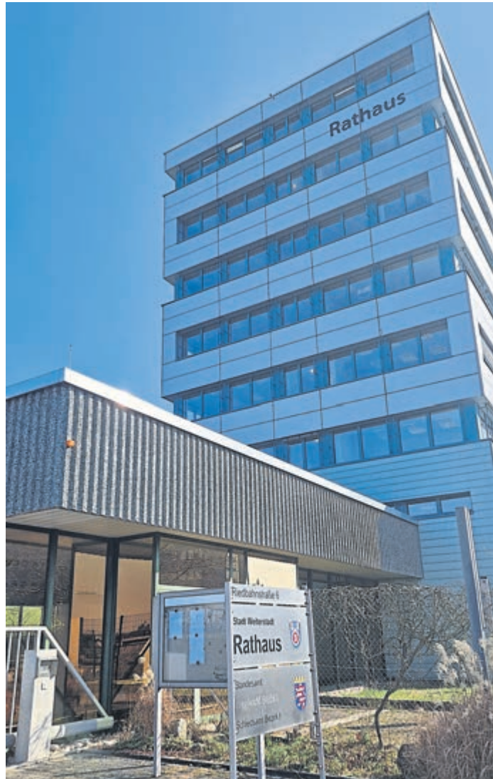
Im Rathaus in der Riedbahnstraße 6 finden im Sitzungssaal Verneuil-sur-Seine die öffentlichen Stadtverordnetenversammlungen statt. Die nächste am Donnerstag, dem 25. Juni, um 19 Uhr.

Wie Bürgermeister Niklas Gehnich auf Nachfrage mitteilt, befindet man sich aktuell noch in einer Evaluation, „ob, wie und wann der Antrag der