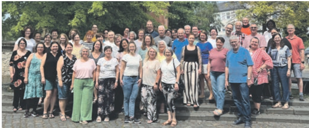
Die „Choriosen“ der Chorgemeinschaft Weiterstadt, verbrachten ein Probenwochenende in Diez, um neue Stücke einzustudieren und alte zu festigen.

Die „Choriosen“ probten ein Wochenende in Diez