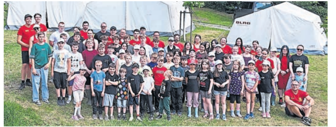
Vor drei der fünf Mannschaftszelte haben sich die Campteilnehmenden versammelt, um später eine gemeinsame Erinnerung auch bildlich teilen zu können.

Am Donnerstagvormittag war es dann endlich so weit: Gegen 10 Uhr trafen die ersten Kinder und Jugendlichen ein. Nach einer herzlichen Begrüßung wurden die Schlafplätze in den Mannschaftszelten bezogen und parallel noch einige Einzelzelte aufgebaut, um allen ausreichend Platz zu bieten. Trotz