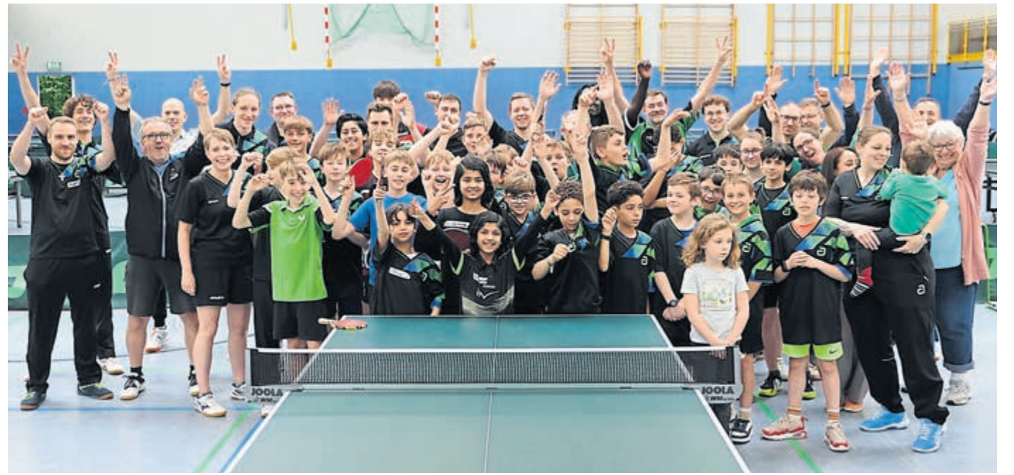
Vier Jahre Freundschaft zwischen den Tischtennisvereinen aus Gräfenhausen und Verneuil-sur-Seine: Am Wochenende von Christi Himmelfahrt waren die Sportlerinnen und Sportler aus Frankreich zu Gast in Gräfenhausen und verbrachten schöne Tag zusammen.

Vier Jahre Freundschaft: Tischtennis verbindet über Ländergrenzen hinweg