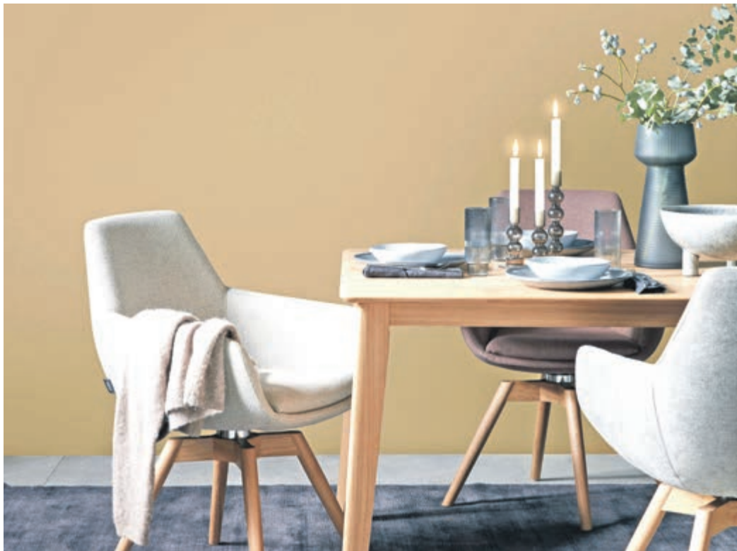
So wohltuend wie ein duftender und wärmender Milchkaffee: Mit der Trendfarbe Macchiato erhält das Zuhause einen lässigen und gleichzeitig entspannten Look.

Wie wäre es beispielsweise mit einem angenehm duftenden und wärmenden Milchkaffee? Das Braun der aktuell angesagten Farbe „Macchiato“ etwa macht ihrem Namen alle Ehre. Mit dem attraktiven und beruhigenden Ton zieht auf unkomplizierte Weise Coffeehouse-Chic ins Zuhause ein. Der warme, fein abgestimmte Brauntönen bewegt sich zwischen einem cremigen Beige sowie einem frischen Kaffee und vermit-