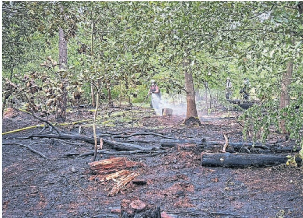
Über 100 Einsatzkräfte aus dem gesamten Landkreis und rund 20 Löschfahrzeuge waren am Freitag, dem 29. Mai, im Wald bei Gräfenhausen im Einsatz, um gemeinsam einen Brand zu bekämpfen.

Bereits auf der Anfahrt sei die Rauchentwicklung deutlich sichtbar gewesen, teilt die Feuerwehr der Stadt Weiterstadt mit. Die genaue Lokalisierung des Brandherds habe sich jedoch zunächst schwierig gestaltet. Nach dem Eintreffen der ersten Kräfte wurde ein Bodenfeuer mit einer Ausdehnung von zunächst rund 50 Metern entdeckt und umgehend die Brandbekämpfung eingelei-