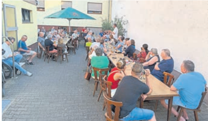
Beim Bürgerstammtisch im Gasthaus zum Adler in Braunshardt konnte man Bürgermeister Niklas Gehnich (stehend, weißes Hemd) Fragen stellen und Wünsche und Anregungen direkt an die „oberste Instanz“ richten.

Braunshardt (red). Der Bürgerstammtisch der Stadt Weiterstadt am 27. Mai im Gasthaus „Zum Adler“ in Braunshardt erfreute sich laut Angaben der Stadtverwaltung großer Resonanz. „Mit nahezu 60 Teilnehmern und Teilnehmern verzeichnete das Format einen neuen Besucherrekord und unterstrich damit das große Interesse der Bürgerinnen und Bürger am direkten Austausch mit der Stadtverwaltung“, so die Stadtverwaltung.