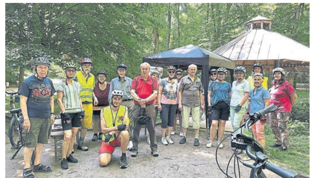
Kurze Rast zum „Water-Tasting“ an der Schwefelquelle im Bad Weilbacher Kurpark.

Die nächste Radtour vor den Sommerferien ist für den 21. Juni geplant.