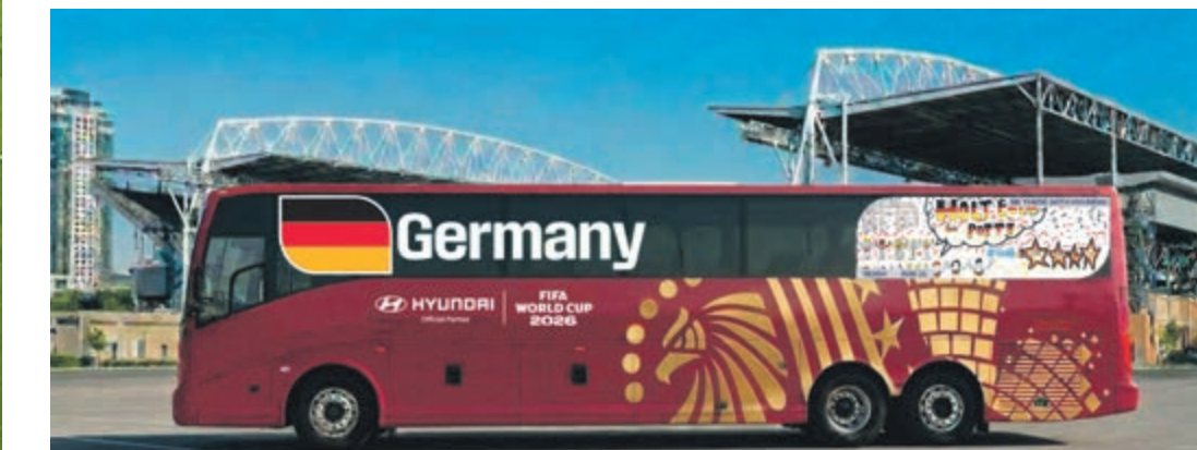
Unter dem Oberbegriff „The Greatest Cheer“ wurden die jungen Fans vor der WM ermutigt, Anfeuerungsmomente für ihre Lieblingsnationalmannschaft visuell auszudrücken. Aus den weltweit eingereichten Beiträgen wurden insgesamt 48 Gewinnermotive ausgewählt, die jeweils eine teilnehmende Nationalmannschaft repräsentieren.