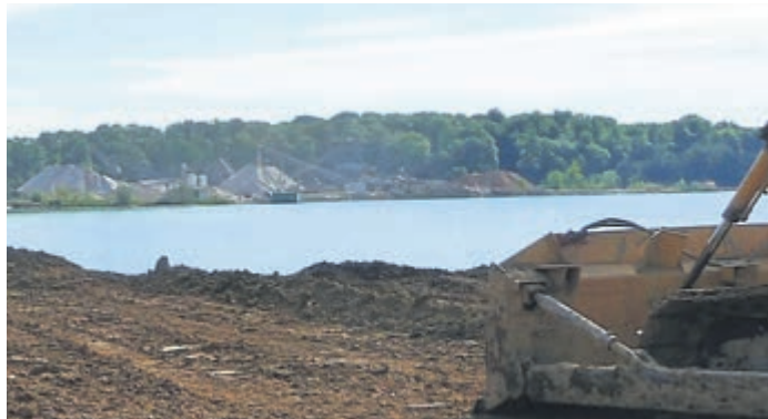
Das RP warnt davor, in Baggerseen zu baden, die dafür nicht freigegeben sind.

Steile Böschungen und Abbaugeräte bergen oft Gefahren, die nicht eingeschätzt werden können. Auch bei ehemaligen, längst stillgelegten Baggerseen kann das sandige Material unter Wasser