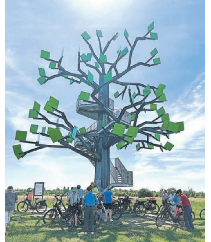
Der Eisenbaum im Naturschutzgebiet Wickerbach Auen.

Nach der Pause ging es weiter durch den ehemaligen Kurpark Bad Weilburg zum „Water-Tasting“ an der dortigen Schwefelquelle. Hinter der Flörsheimer Warte dann ein weiterer „Erlebnispunkt“ im Gebiet des Regionalparks, der begehbare, zehn Meter hohe Eisenbaum, mit Blick über das zuvor durchradelte NSG Wickerbachsaue bis hinüber zum Großen Feldberg. Über die Opelbrücke ging es dann zurück über den Main bis zum Raunheimer Gewerbegebiet Airport Garden. Zwei Datenzentren des US-Unternehmens Vintage