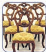
8 Stühle beziehen - 6 bezahlen