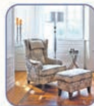
Sessel mit Hocker - Hocker kostenlos