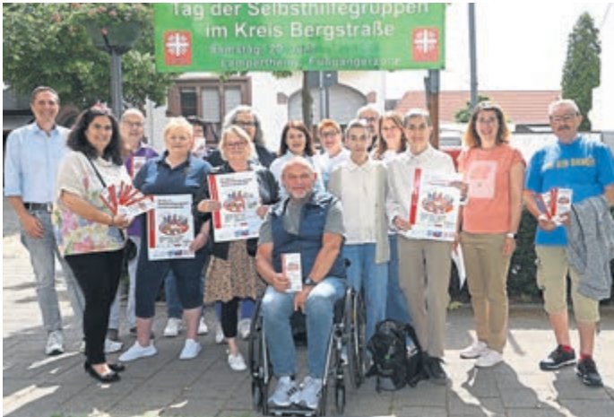
Zahlreiche Bergsträßer Selbsthilfegruppen informieren am 20. Juni in Lampertheim über ihr Angebot.

„Selbsthilfegruppen sind ein unverzichtbarer Bestandteil unseres sozialen und gesundheitlichen Unterstützungssystems. Sie bieten Menschen in schwierigen Lebenssituationen die Möglichkeit, Verständnis, Austausch und neue Perspektiven zu finden“, erklärte Heike Kopf-Rohner bei der Vorstellung der Veranstaltung im Lampertheimer Stadthaus. Schätzungen zufolge engagieren sich bundesweit rund 3,5 Millionen Menschen in bis zu 100.000 Selbsthilfegruppen.