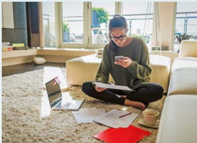
Genau rechnen und rechtzeitig an später denken: Die private Altersvorsorge ist für Frauen besonders wichtig.

In der Folge erwerben Frauen über das Berufsleben hinweg im Durchschnitt deutlich geringere Rentenansprüche als Männer. Ein früher Blick auf die eigene Altersvorsorge ist daher für sie besonders wichtig. Zudem sollten Paare früh miteinander besprechen, wie Erwerbs- und Fürsorgearbeit fair aufgeteilt wird. Denn eine längere Elternzeit oder die Reduzierung auf Teilzeit mindern nicht nur das aktuelle Gehalt, sondern führen zu weniger Rentenpunkten und geringerer Berufserfahrung, was den Verdienstabstand weiter vergrößert. Wenn ein Elternteil sich stärker um die Kinder oder andere Angehörige kümmert, kann ein finanzieller Aus-