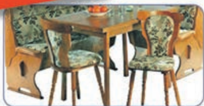
Eckbank Neubezug, Stoff oder Leder - Stühle kostenlos