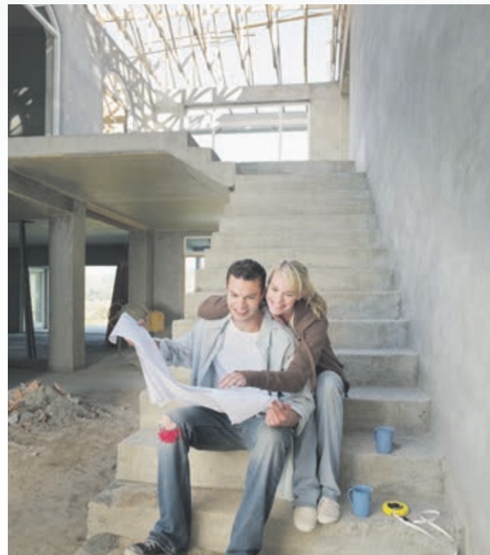
Neue rechtliche Vorgaben sollen das Bauen einfacher und günstiger machen.

Immobilien, die mit fossilen Brennstoffen wie Öl oder Gas beheizt werden – reduziert jedoch einen möglichen Verkaufspreis des Hauses oder der Wohnung. Natürlich müssen im Nachgang anfallende Sanierungskosten in die Finanzierung mit eingerechnet werden. Nichtsdestotrotz kann sich so der Erwerb eines Altbaus lohnen.