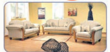
Couchgarnitur Neubezug, Leder oder Stoff - Sessel kostenlos