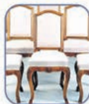
6 Stühle beziehen - 4 bezahlen