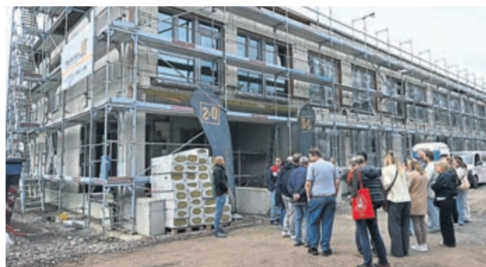
Der Bau der Kita Morgentau in Lorsch schreitet gut voran und soll bis Oktober beendet werden.

Medienvertretern zu zeigen. Die neue, zweigeschossige Kita ist so groß, dass man sich beinahe darin verlaufen kann. Ein langer Mittelgang verbindet die jeweiligen Räume. Die jeweiligen Spiel- und Aufenthaltsräume sind großzügig gestaltet. „Das wird natürlich noch alles farblich gestaltet, so dass die Kinder immer genau wissen, wo ihr Bereich ist“, wie Romanovski ergänzte. Das Gebäude wird ab Herbst vier Kitagruppen beherbergen. Und es bietet Platz für zwei Krippen-Gruppen (U3). Träger der neuen Kita ist das Familienzentrum Bensheim. Im Oktober können hier nicht nur die Kinder einziehen, auch das Außengelände soll bis dahin schon fertiggestellt sein. Das Gebäude ist nach neuesten energetischen Standards errichtet. Auf dem Dach kommt eine große PV-Anlage, die Strom für die Kita liefert, aber auch ins Netz einspeist.