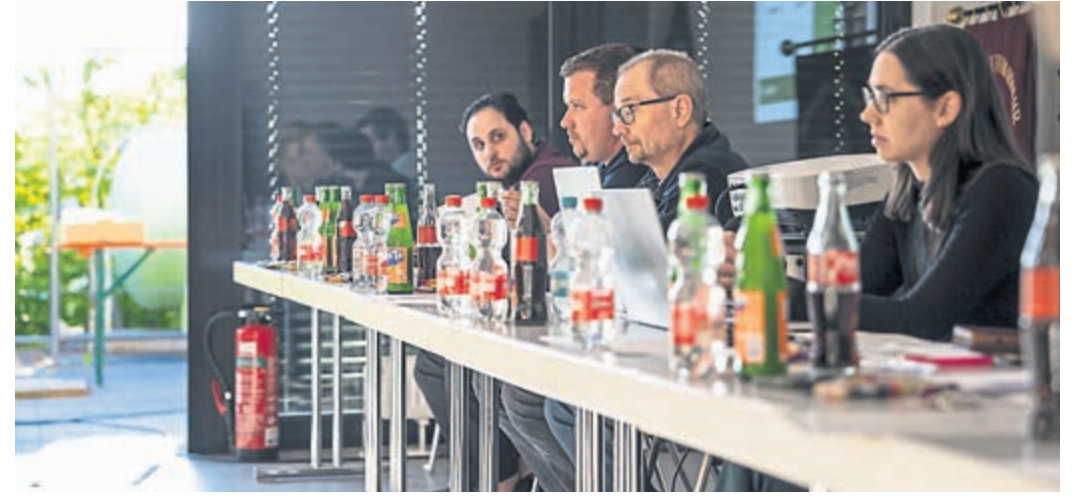
Der Feuerwehrverein unterstützt die Arbeit der Freiwilligen Feuerwehr immer sehr.

Rund 12.300 Euro Spenden erreichten den Feuerwehrverein im zurückliegenden Jahr, diese Mittel sollen unter anderem in die „Florianstube“ fließen, einem künftigen zentralen Wohnzimmer für alle Abteilungen, das gemeinsam