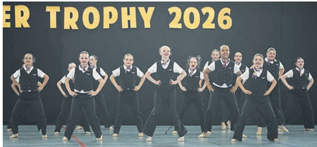
Goldmedaille für die „Violets“: Sie sorgten für eine kleine Sensation, als sie sich in der Kategorie Kinder den Titel ernteten.