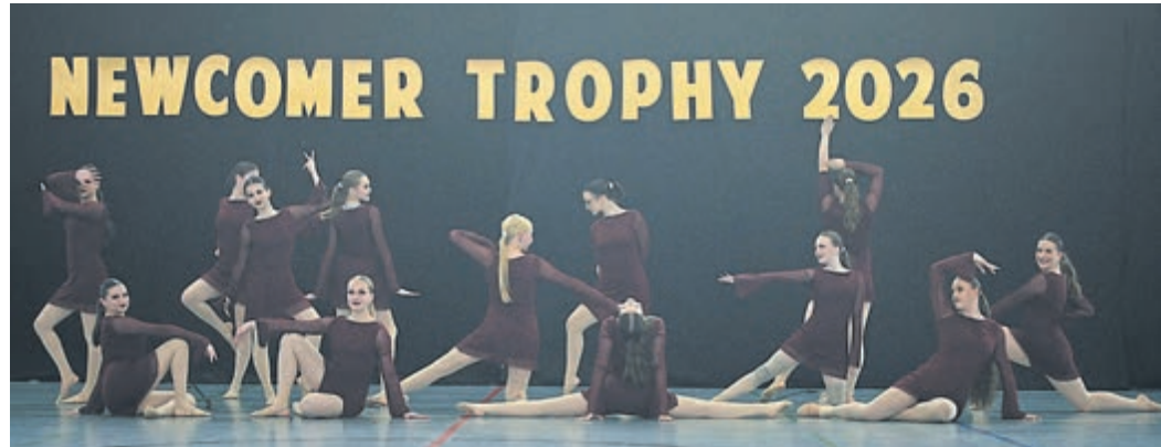
Die „Les Fleuries“ holten sich Gold in der Junioren-Kategorie.

Ein Event dieser Größenordnung mit fast 400 Aktiven ist nur durch breite Unterstützung realisierbar. Für den reibungslosen Ablauf hinter den Kulissen sorgten die schuleigene Technik AG, die den gesamten Tag über für den perfekten Ton verantwortlich war, sowie der Förderkreis der ADS, der gemeinsam mit der engagierten Elternschaft die komplette Verpflegung und Organisation des großen Buffets stemmte.