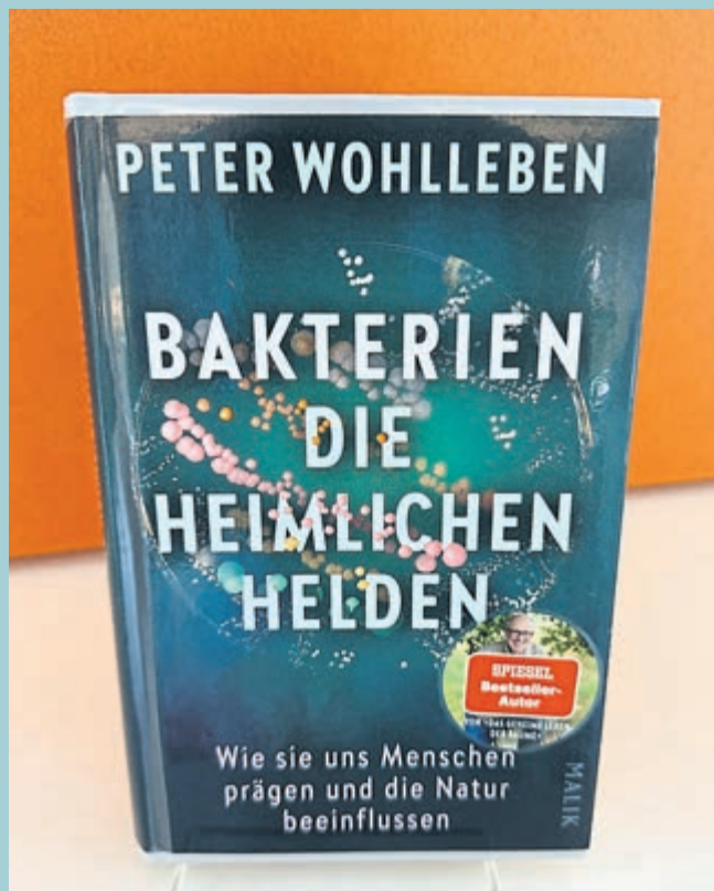
Das Team der Stadtbücherei im Medienschiff findet jede Woche einen neuen, spannenden Büchertipp für die Leserschaft des „Wochen-Kurier“.

Heute: „Bakterien - die heimlichen Helden“ von Peter Wohlleben (Sachbuch)