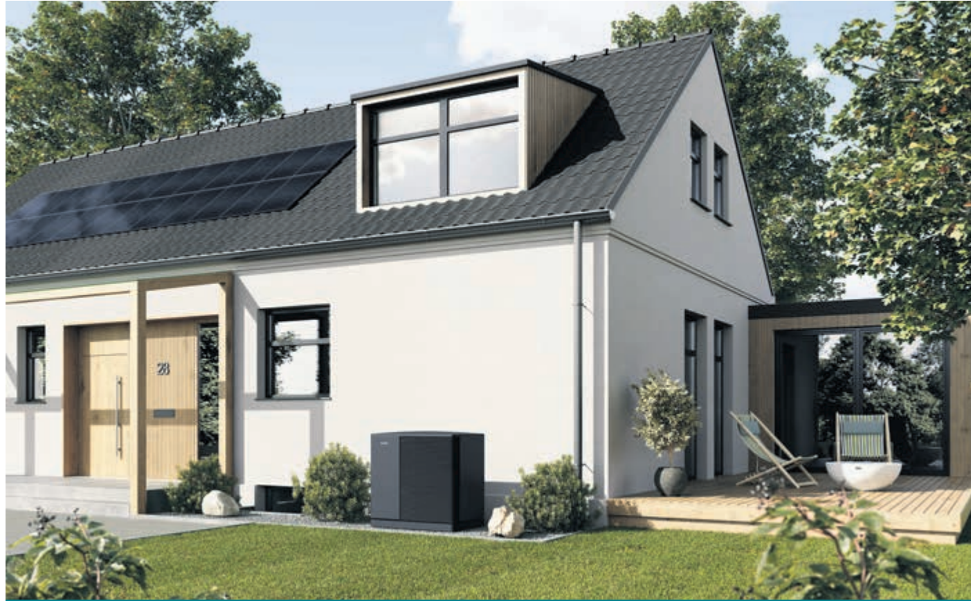
Schneller ins neue Zuhause: Der Trend zum Fertighaus hält an – meist in Kombination mit Wärmepumpe und Photovoltaik.