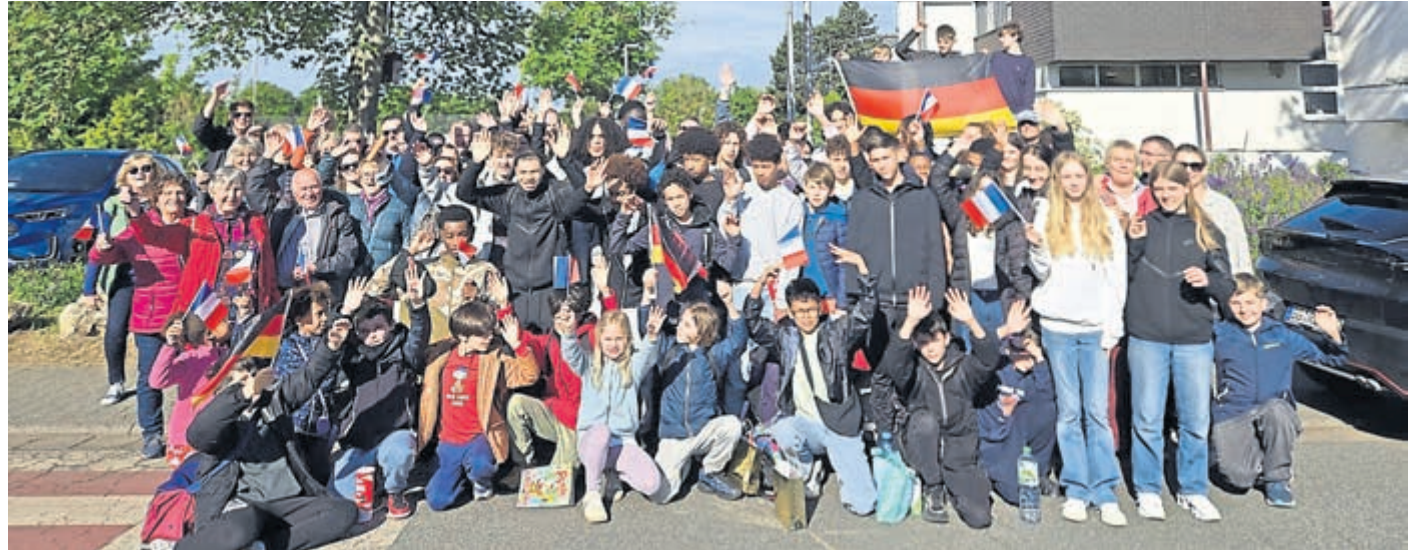
Am Himmelfahrtswochenende waren 42 Basketballerinnen und Basketballer mit ihren Betreuer:innen aus Verneuil-sur-Seine zu Gast bei der SG Weiterstadt.

SGW-Basketball-Jugend empfing französische Partnerinnen und Partner