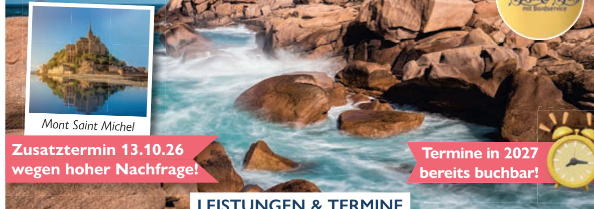
Mont Saint Michel

5 Sterne sup STEWA Bistro-Bus mit Bordservice