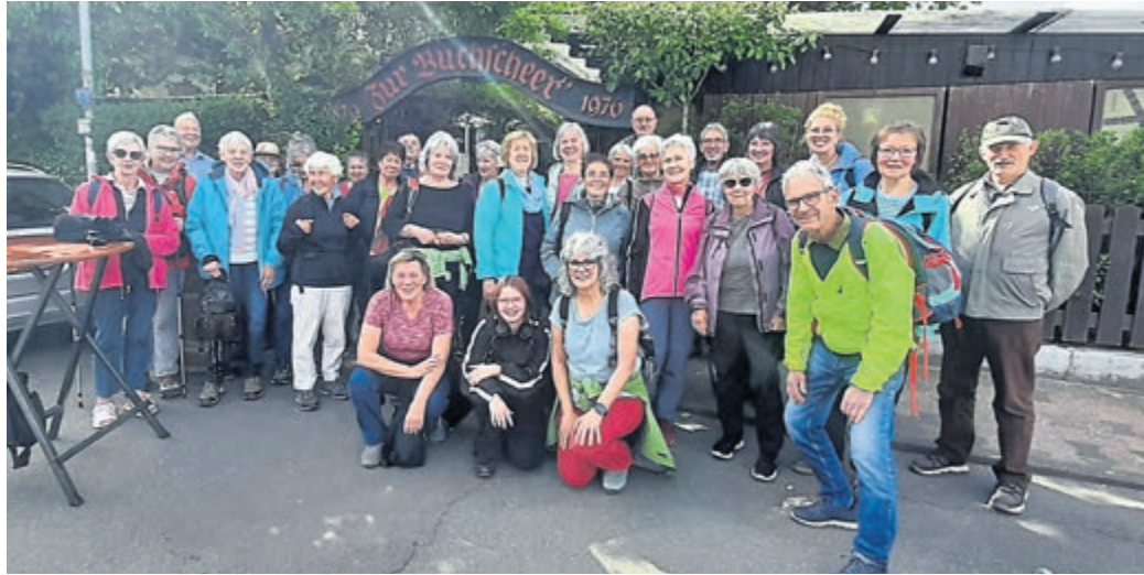
Das Gasthaus in Luisa bei Frankfurt war Endpunkt der Wanderung der SKG Gräfenhausen durch den Frankfurter Stadtwald.

Wandergruppe erkundet das Grün von Frankfurt