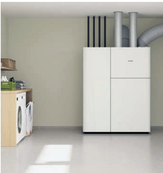
Moderne Haustechnik - wie diese All-in-one-Lösung - punktet mit vielfältigen Funktionen und guter Energieeffizienz.