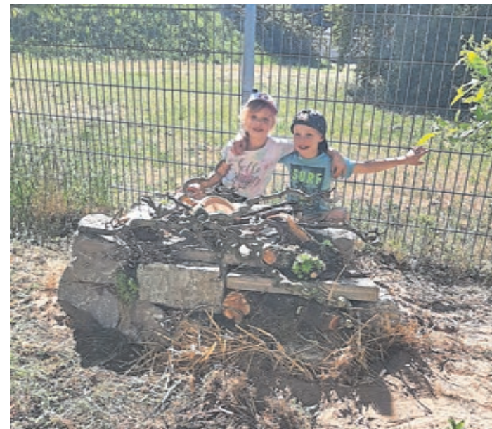
Ein Herz für alles, was da krecht und fleucht: Die Kinder des Zirkus Gaja-Nana der SG Weiterstadt sowie alle Betreuerinnen und Betreuer haben für Hummeln eine Burg und für Insekten Häuschen und Nistkästen gebastelt und zum Teil schon aufgebaut. Auch Wildblumen und Kräuter, Gräser und Sträucher wurden gepflanzt, damit die Tiere auch Nahrung finden, die sie brauchen, um hier ein Heim zu finden.

Eine Familie habe sich liebevoll um die Erbauung einer einzigartigen Eidechsenburg mit schöner Bepflanzung gekümmert und in unmittelbarer Nähe habe auch die Hummelburg ihren Standort gefunden. „Die Schmetterlingshäuser und Nistkästen warten noch auf die Anbringung am rechten Platz“, so Baader. Eine weitere Gruppe habe fleißig die Aufhängung und Befüllung aller Futterplätze für die Vögel vorgenommen und sich um die Platzierung der Wassertränken gekümmert. Die Tierfreuten sich über das frische