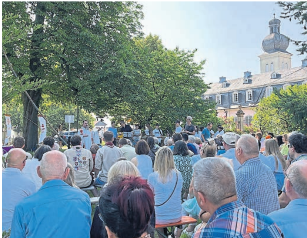
Im vergangenen Jahr (Foto) fand die Fronleichnamsprozession in Braunshardt und im Schlosspark statt.