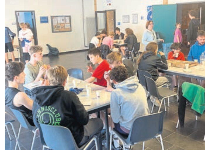
Italienische Pizza-Pause beim deutsch-französischen Wochenende der SG Weiterstadt.

Am Samstagmorgen wurde das Turnier fortgesetzt und der endgültige Tabellenstand erspielt. Einen Mittags-Snack gab es zur Stärkung an der Halle, ehe die mit Spannung erwarteten „Länderspiele“ stattfanden. Zuerst begannen die beiden gemischten U12-Teams, bei denen die französische Mannschaft mit 30:21 klar als Sieger vom Platz ging. Bei der U14-Begegnung siegte dann das SGW-Team mit 34:28. Jubeln konnte dann