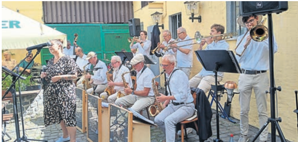
Am Samstag, dem 7. Juni, lädt das Swing-Sound-Orchestra in den Biergarten der Schönen Aussicht zum musikalischen Frühschoppen ein.

Das Swing-Sound-Orchestra spielt wieder in Weiterstadt