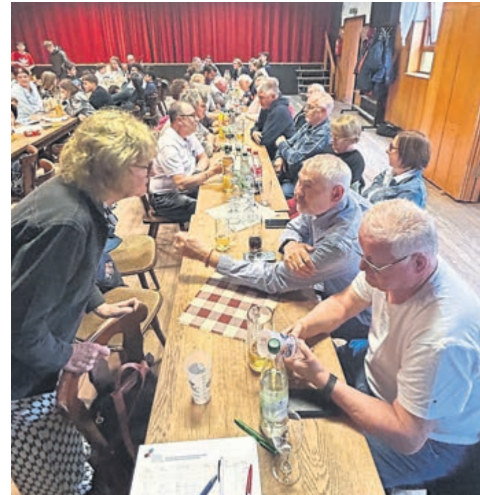
Die Begleitpersonen tauschten ihre Erfahrungen des Wochenendes am Abschlussabend noch einmal aus.

wieder die französische U16-Mannschaft: sie gewann deutlich mit 38:29 über die U16 der SGW. Das letzte Spiel bestritten die beiden U18 Mannschaften. Hier siegte nach anfänglichen Schwierigkeiten die SGW mit 36:26 am Ende deutlich.