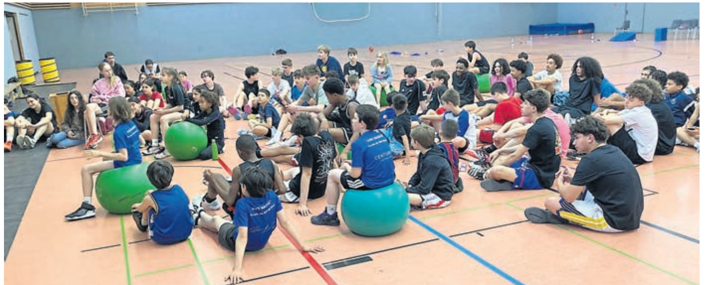
Die Spielerinnen und Spieler aus Frankreich und Deutschland trafen sich zu einer Lagebesprechung in der Weiterstädter Halle.

Allen Beteiligten hat es wieder einen riesigen Spaß gemacht. Die französischen Gäste sind mit sehr guten Eindrücken nach Hause zurückgekehrt, die deutschen Gastgeber:innen waren von ihren jugendlichen Gästen durchweg äußerst angetan. Der Kommentar eines Weiterstädter Teilnehmers: „Freundschaften vertieft, neue Bekanntschaft gemacht, keine Verletzungen, viele gemeinsame Späße, tolle Abend-Events, prima Ausflüge.“ So haben alle gewonnen – und so soll es auch sein!