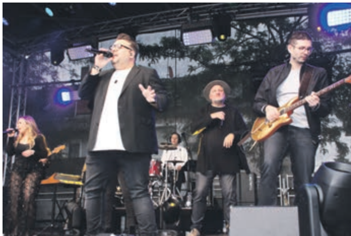
„The Groove Generation“ ist auch in diesem Jahr beim Stadtfest Garant für tolle Stimmung.

Bürstadt (red). Vom 29. bis 31. Mai verwandelt sich die Bürstädter Innenstadt erneut in eine große Festmeile. Am Freitag, 29. Mai, startet das Stadtfestwochenende mit einem besonderen Auftakt. Traditionell wird das Fest um 18 Uhr mit dem offiziellen Fassbieranstich eröffnet.