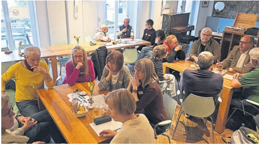
18 Bürgerinnen und Bürger diskutierten in Bensheim bei der ersten „Diskutier-Bar“ im Café Klostergarten über gesellschaftliche Fragen.

Bensheim (red). 18 Personen haben sich dieser Tage im Bensheimer Café Klostergarten zur ersten „Diskutier-Bar“ getroffen. Veranstaltet wurde das neue Dialogformat von Kooperationspartnern des Bündnisses Demokratie und Zivilcourage an der Bergstraße, unterstützt vom Evangelischen Dekanat Bergstraße sowie dem Verein „Fabian Salars Erbe“ (Verein für Toleranz & Zivilcourage). Darüber berichtet das Evangelische Dekanat Bergstraße in einer Pressemitteilung. In moderierten Tischrunden diskutierten die Teilnehmenden über gesellschaftliche Fragen und brachten eigene Themen ein. Die Bandbreite reichte von kommunalen Herausforderungen bis hin zu persönlichen Lebensfragen. Im Vorfeld hatten die Organisierenden Themen wie „Warum hat meine Stadt zu wenig Geld?“ oder „Pfleger: Was tun, wenn Eltern alt werden?“ vorgeschlagen.