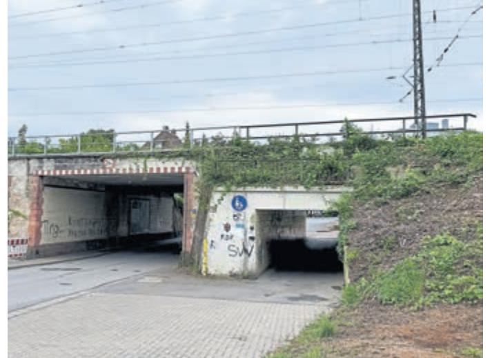
Wegen Bauarbeiten an der Bahnunterführung wird die Gartenstraße von Juni bis September voll gesperrt.

Wie die Stadt berichtet, wird nach Abschluss der Arbeiten der Fußweg nicht mehr – wie bislang – durch eine separate Unterführung geführt. Stattdessen entstehen beidseitig der Fahrbahn Geh- und Radwege mit jeweils zweieinhalb Metern Breite.