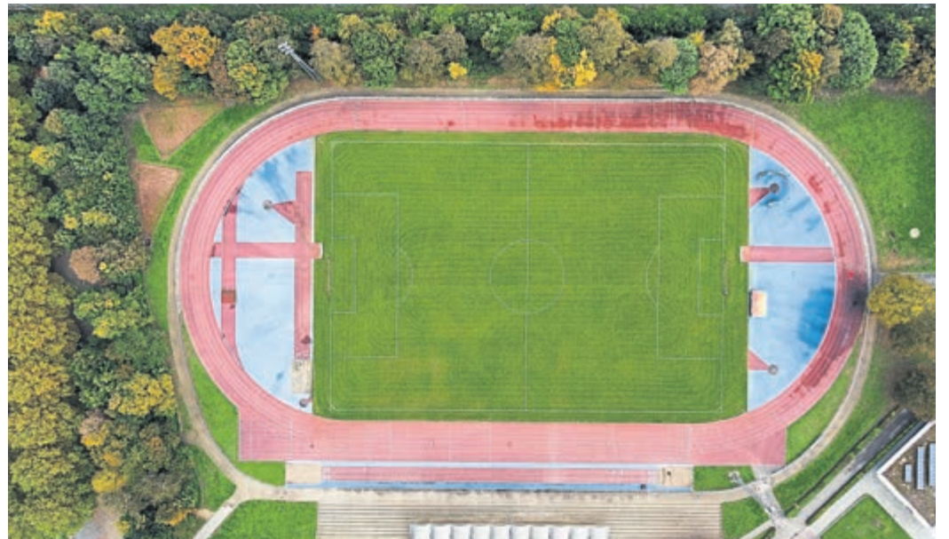
Die Stadt Bensheim hofft, mit Fördermitteln das in die Jahre gekommene Weiherstadion sanieren zu können.

Die ursprüngliche Kostenschätzung belief sich auf 1,65 Millionen Euro. Mit welchen Mehrkosten durch allgemei-