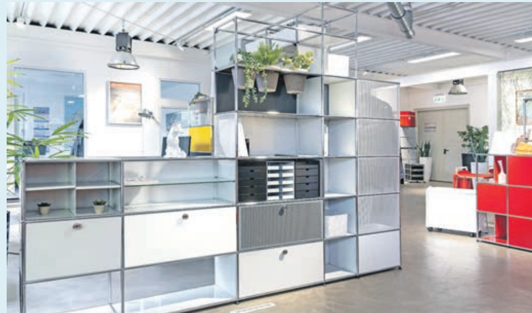
KS Büromöbel empfängt seine Kundinnen und Kunden mit einem modernen, hellen und freundlichen Ambiente. Zudem ist man Second-Hand-Partner von USM Haller.

richtungen im Kreislauf und Ressourcen werden nachhaltig geschont. Mit dem wachsenden Anteil an Homeoffice Arbeitsplätzen steigen die Anforderungen an die Büroeinrichtung. Viele Menschen haben aus provisorischen Lösungen dauerhafte Arbeitsplätze geschaffen und investieren heute gezielt in gesundheitsfördernde Möbel. Renner sind höhenverstellbare Schreibtische, rückenfreundliche Bürostühle und multifunktionale Lösungen für kleinere Räume. Auch praktische Details wie integriertes Kabelmanagement oder clevere