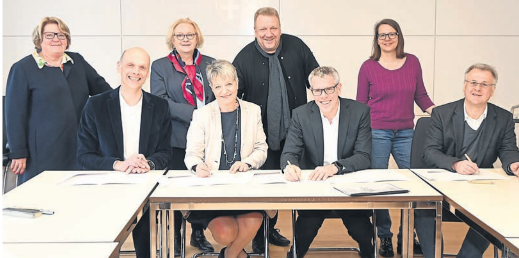
Die Städte Zwingenberg, Bensheim und Heppenheim haben kürzlich gemeinsam den Bau eines die Städte verbindenden Fahrradwegs beschlossen.