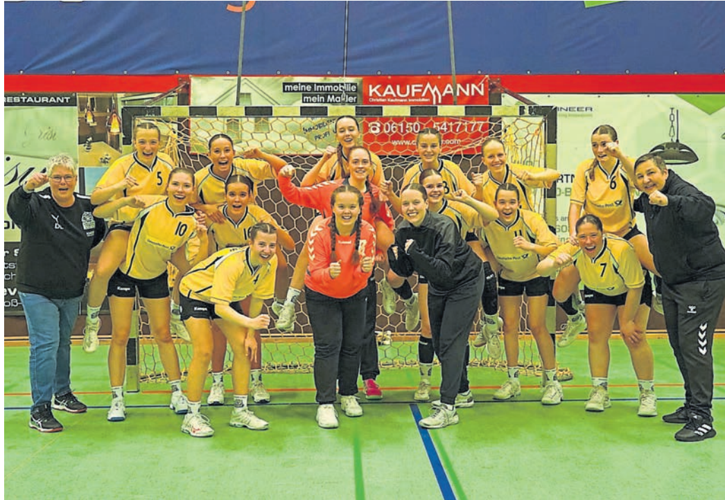
Freude bei den Yellow Tigers, der weiblichen B-Jugend der HSG WBW, über den hohen Sieg in der Regionalliga gegen Büttelborn.

Beiden Mannschaften merkte man zu Beginn die Nervosität an, sodass sich das Spiel bis zur zehnten Minute (3:2) ausgeglichen gestaltete. Die Abwehr der Yellow Tigers stand stets stabil, lediglich im Angriff ging das Team von Sabina Marzano und Doro Lange zu leichtfertig mit den schön herausgespielten Torchancen um. Danach legten die Mädels in eigener Unterzahlsituation die Nervosität ab, fanden in ihr gewohntes Spiel und konnten sich mit einem 8:1-Lauf absetzen. Die Gegnerinnen aus Büttelborn scheiterten häufig an der starken offensiven und ball-