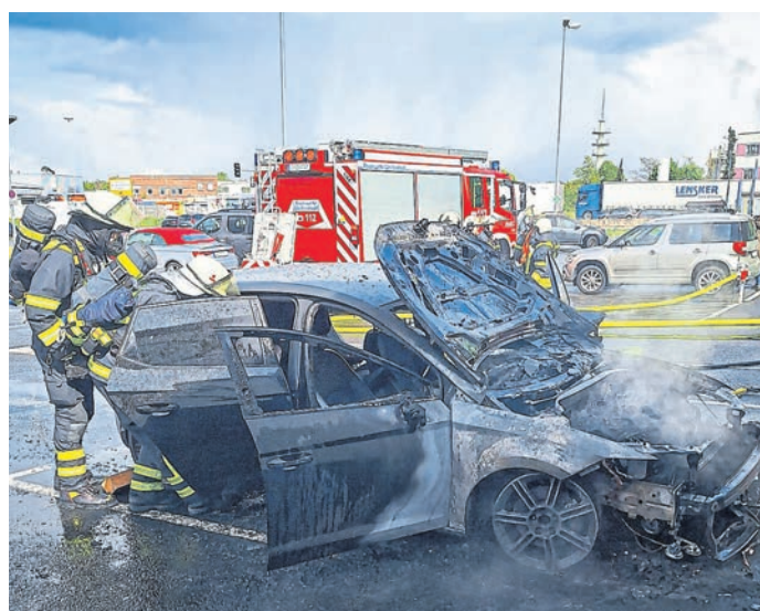
Das Fahrzeug konnte zwar gelöscht werden, allerdings entstand an ihm ein Totalschaden. Menschen kamen bei dem Fahrzeugbrand nicht zu Schaden, teilt die Feuerwehr mit.