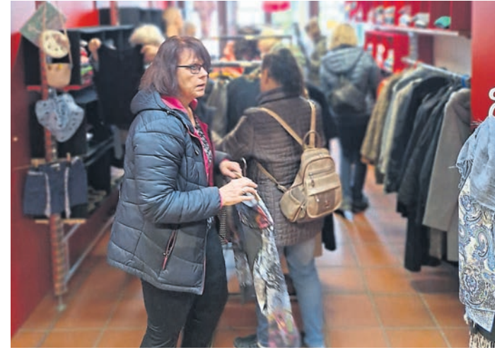
Eine schöne Auswahl unterschiedlichster gebrauchter Kleidung hatte das „Schatzkästchen“ des DRK Gräfenhausen-Schneppenhausen, gleich zu Anfang zu bieten.