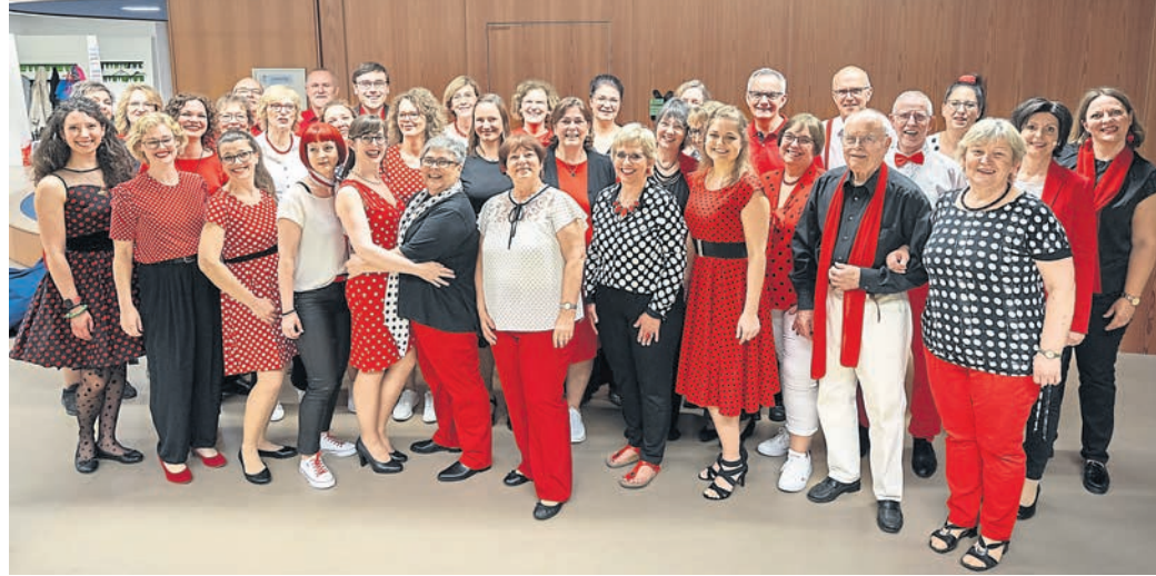
Der Chor Voice begeisterte am vergangenen Wochenende gleich mit zwei Konzertabenden die Gäste mit seinem vielfältigen Programm.