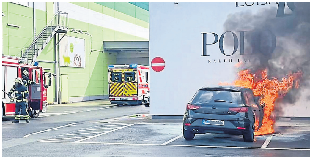
Zu einem brennenden Fahrzeug wurden die Einsatzkräfte der Freiwilligen Feuerwehr Weiterstadt gerufen. Das Auto brannte lichterloh und die Flammen drohten, auf das angrenzende Gebäude überzugreifen. Doch die Feuerwehr konnte dies verhindern und den Brand schnell löschen.

Riedbahn (hst). Am Montag, 22. April, wurde die Einsatzabteilung der Freiwilligen Feuerwehr der Stadt Weiterstadt um 15.44 Uhr zu einem Fahrzeugbrand in die Robert Koch-Straße in der Riedbahn gerufen. „Aufgrund weiterer Notrufe, dass das Fahrzeug stärker brennen würde und für das angrenzende Gebäude Gefahr besteht, wurde wenige Minuten später das Stichwort auf ‚F2‘ erhöht und zusätzlich die Einsatzabteilung Schneppenhausen sowie ein Rettungswagen an die Einsatzstelle alarmiert“, teilt die Feuerwehr mit. Das ersteintreffende Fahrzeug löschte das brennende Auto mittels Schnellangriff, weitere Einheiten kontrollierten das Gebäude. Das Gebäude konnte von der Feuerwehr geschützt werden, hier entstand keinerlei Brandschaden. Das brennende Fahrzeug erlitt allerdings einen Totalschaden. Wie die