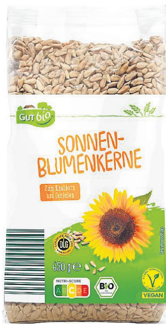
Sonnenblumenkerne von „Gut Bio“.

Das Produkt kann in allen Aldi-Filialen zurückgegeben werden. Der Kaufpreis werde erstattet, auch ohne Vorlage des Kassensbons, teilt das Bundesamt für Verbraucherschutz und Lebensmittelsicherheit mit.