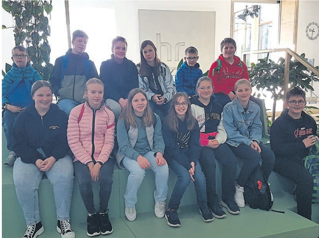
Die mitgereisten Jugendlichen des Musikvereins Gräfenhausen besuchten die Proben der HR-Big Band im Hessischen Rundfunk in Frankfurt.

Jugendorchester Gräfenhausen besucht HR-Big Band