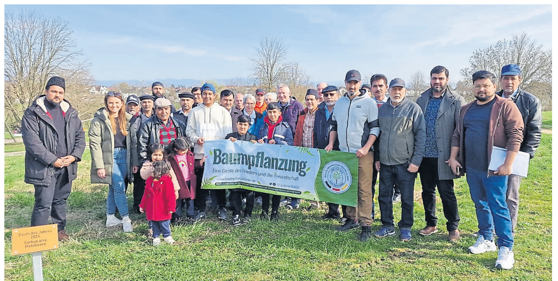
Im Rheinpark traf sich kürzlich auf Einladung der Ahmadiyya Gemeinde eine Gruppe, um gemeinsam einen Baum zu pflanzen.