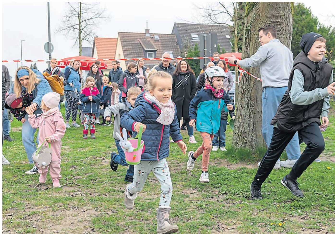
Stockstadt (sh). Einiges zu tun hatten zahlreiche Kinder am vergangenen Samstagnachmittag auf dem Spielplatz neben dem Schwimmbad in Stockstadt. Der Osterhase hatte rund 400 Eier und Schokoladensüßigkeiten bei der Stockstädter SPD gelassen. Die Mitglieder hatten diese dann im Vorfeld auf dem gesamten Areal versteckt. Auch für das leibliche Wohl war mit Kaffee und Kuchen bestens gesorgt.

Fröhliche Ostereiersuche der Stockstädter SPD