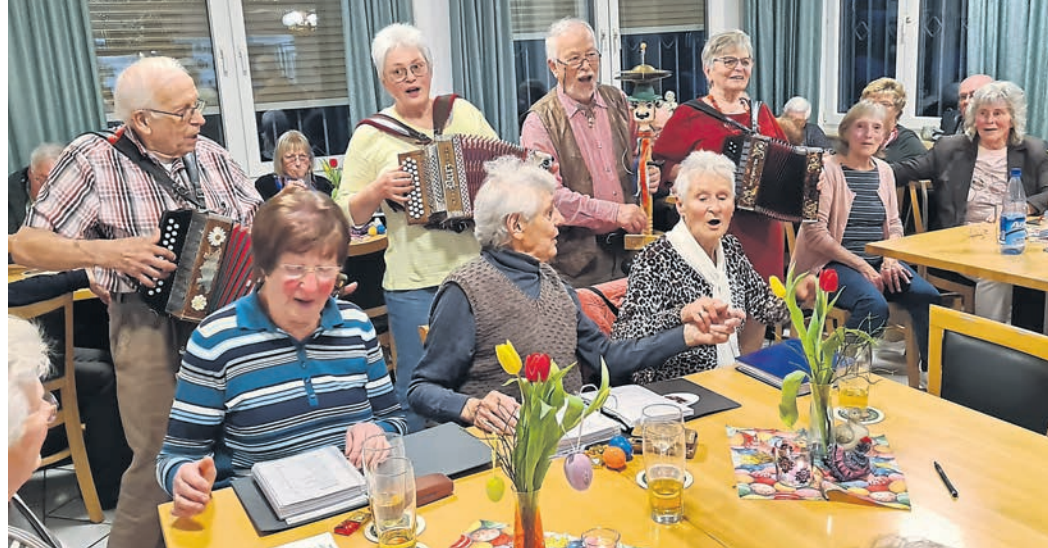
Gäste und Mitglieder der BdV-Musik- und Gesangsgruppe beim gemeinsamen Singen der Heimatlieder im Biebesheimer Anglervereinsheim.

An diesen Zusammenkünften würden, oft mit Leidenschaft, nicht nur Sudenteutsche teilnehmen. Auftritte der BdV-Musik- und Gesangsgruppe in der nä-