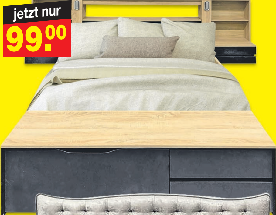
Schlaf- zimmer-Set 192329