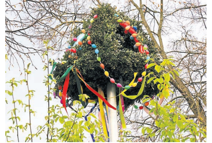
Biebesheim (haza). Alle Jahre wieder: Auch diesmal sorgte weithin sichtbare Osterkrone auf dem Biebesheimer Markt- platz schon vor dem Osterwochenende für festliche Stimmung. Aufgestellt wurde diese traditionell von den Biebesheimer Landfrauen.