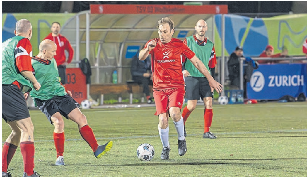
Szene aus dem Eröffnungsspiel zwischen dem TSV Wolfskehlen (grüne Leibchen) und dem TV Crumstadt. Am setzten sich die Gastgeber aus dem Riedstädter Norden mit 3:1 durch.

gangenen Donnerstagabend auf dem Wolfskehlener Sportplatz mit der Partie des TSV Wolfskehlen gegen die „Old Boys“ des TV Crumstadt. Wie es sich für große Abende gehört, fand die Partie unter Flutlicht statt. Am Ende setzte sich die Heimmannschaft souverän mit 3:1 durch und ist somit auch der erste Tabellenführer der Riedstadtliga. Spielplan und Ergebnisse: fussball.de