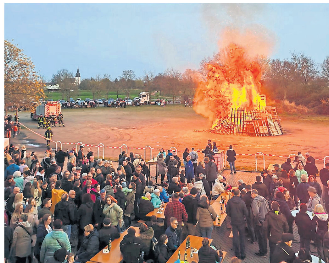
Nach der Premiere im vergangenen Jahr gab es am Ostersonntag das zweite Osterfeuer vor der Rheinhalle in Biebesheim.

Biebesheim (haza). Am Ostersonntag wurde in Biebesheim zum zweiten Mal auf dem Parkplatz an der Rheinhalle ein Osterfeuer entzündet. In Zusammenarbeit mit dem Kulturamt der Gemeinde waren es die Mitglieder der Freiwilligen Feuerwehr sowie der Ortsvereinigung des Deutschen Roten Kreuzes und des Evangelischen Bläserchors, die dieses Event veranstalten. Für die rund 700 Besucherinnen und Besucher hatte die Rheinkultur Bierzeltgarnituren aufgestellt, für das leibliche Wohl war ebenfalls bestens gesorgt. Der Evangelische Bläserchor begleitete die Veranstaltung musikalisch.