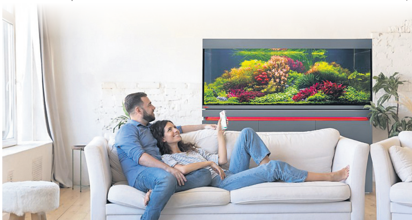
Ein Aquarium-Bekken lädt zu aufregenden Beobachtungen der Unterwasserwelt ein und verleiht jedem Wohnraum das gewisse Etwas.

Lichtstimmung wie in der Natur Beliebte Tools unter Aquarianern