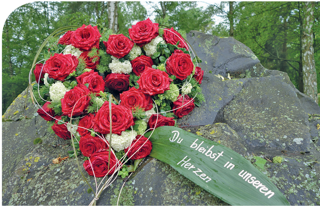
Ein Blumenherz erinnert an die geliebte Person, die verstorben ist.