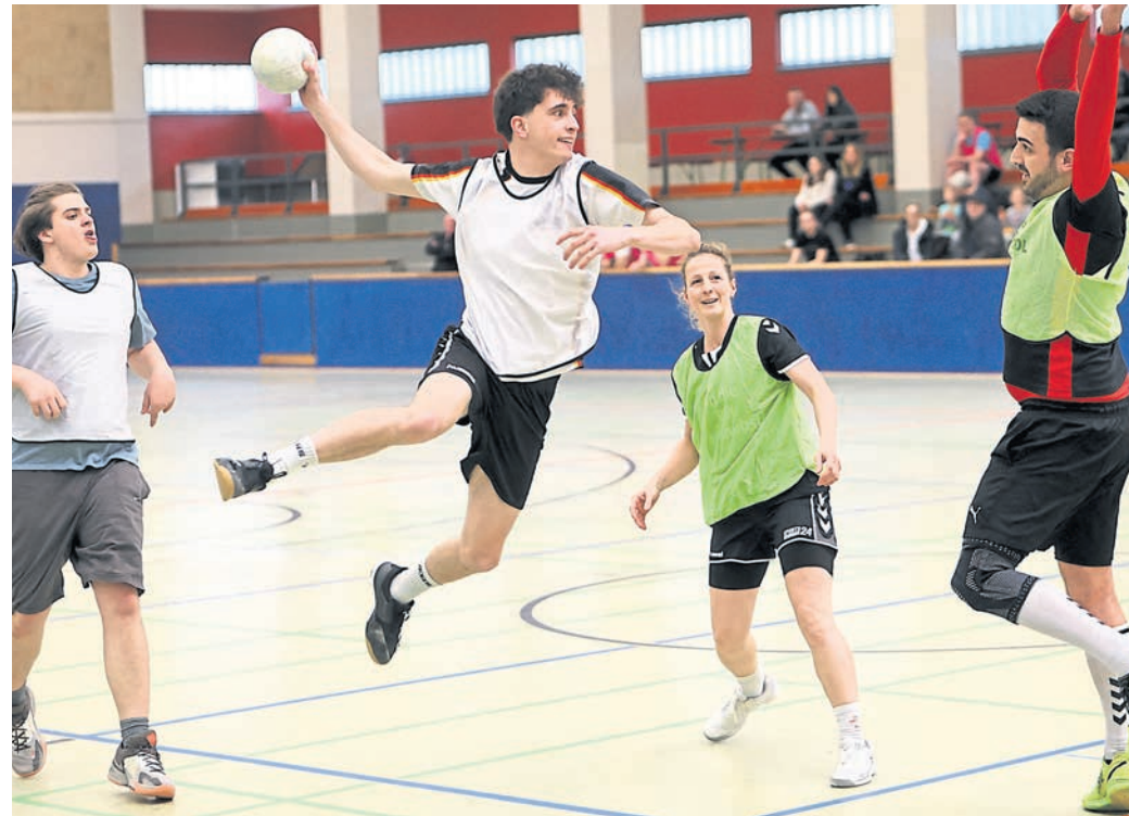
Reger Betrieb herrschte beim Jedermann-Turnier des Gernsheimer SC am vergangenen Samstag.

Nach einer anschließenden Siegerehrung und einem gemütlichen Ausklang in der Halle trafen sich noch über 20 Teilnehmende zum Tagesabschluss in der Gernsheimer Kult-Kneipe „Zum Karpfen“.