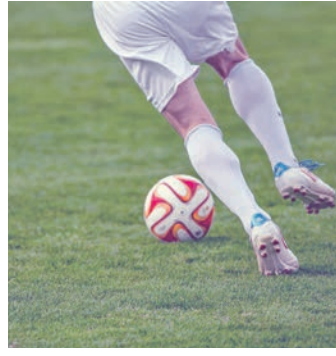
Die FTG ist mitten im Abstiegskampf.

Bereits in der 12. Spielminute hatten die FTG'er durch Kcilrep die große Chance, mit 0:1 in Führung zu gehen. Nach schöner Vorarbeit von Huede schaffte es Kcilrep allerdings nicht, die Kugel im Arheilger Kasten unterzubringen. In der 21. Spielminute durften die Freien-Turner dann doch jubeln, nach einem Foul an Sabatino entschied der Schiedsrichter auf Freistoß kurz vor der Strafraumlinie. Knauer nahm Maß und erzielte die bis dahin nicht unverdiente 0:1-Führung. Bis zur 31. Spielminute fehlte es der Partie an Highlights. Doch dann kamen die Arheilger Hausherrn zu ihrer ersten Torchance, verursacht durch einen verunglückten Klärungsversuch der FTG-Abwehr. Die SG kam völlig frei am Elfmeterpunkt zum Abschluss und erzielte den 1:1-Ausgleich. Ein Gegenangriff aus der Kategorie völlig unnötig, wie die FTG den Spielverlauf einschätzte. Die FTG-Kicker zeigten sich vom Ausgleich vorerst unbeeindruckt, ließen weiterhin wenig zu und kamen durch Kcilrep kurz vor der Pause zu einer weiteren guten Torchance. Nach einem schönen Pass von Haas zog dieser am rechten Strafraumrand