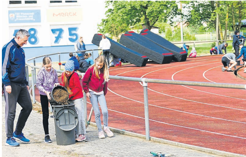
Gemeinsam wurde das TSV-Stadion kürzlich mit einem ausgedehnten Arbeitseinsatz aus dem Winterschlaf geholt.

Pfungstadt (red). Mit Vorfreude und Einsatz bereitet sich die Leichtathletikabteilung des TSV Pfungstadt auf die kommende Freiluftsaison vor, geht aus einer Pressemitteilung hervor. Über 40 Mitglieder – von Kindern bis zu den Seniorinnen und Senioren – trafen sich am vergangenen Samstag, um das Vereinsstadion entsprechend herzurichten. Von der Hochsprunganlage bis zur Tartananlage wurde alles sorgfältig inspiziert und instand gesetzt, berichten die Verantwortlichen. Die Vorbereitungen umfassen nicht nur den Aufbau der Sportanlagen, sondern auch das Beseitigen von Unkraut, Moos und Algen, um optimale Bedingungen