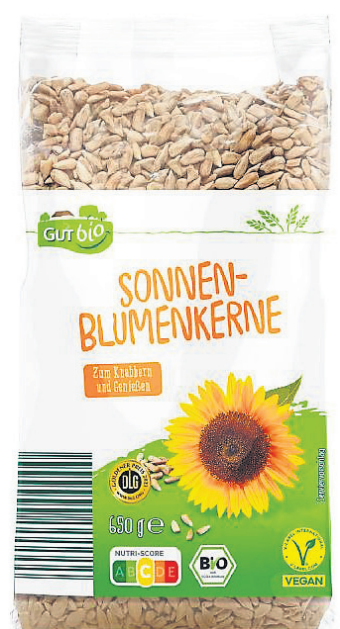
Sonnenblumenkerne von „Gut Bio“, mit dem Mindesthaltbarkeitsdatum 03.2025, können mit Salmonellen verunreinigt sein und werden zurückgerufen.

Region (hst). Der Hersteller Estyria Naturprodukte GmbH informiert über den Rückruf des Artikels „Gut Bio Sonnenblumenkerne, 650g“, ausschließlich mit der Chargennummer 23007616/1 und mit dem Mindesthaltbarkeitsdatum „03.2025“. Das betroffene Produkt wurde bei Aldi-Süd und Aldi-Nord verkauft. Wie mitgeteilt wird, wurden im Rahmen von Eigenuntersuchungen Salmonellen positiv nachgewiesen. Salmonellen können Auslöser von Magen- und Darmerkrankungen (Salmonellose) sein. Da ein gesundheitliches Risiko nicht ausgeschlossen werden kann, sollten Kund:innen den Rückruf unbedingt beachten und das betroffene Produkt nicht verzehren. Das Produkt kann in allen Aldi-Filialen zurückgegeben werden. Der Kaufpreis wird erstattet, auch ohne Vorlage des Kassensbons, teilt das Bundesamt für Verbra-