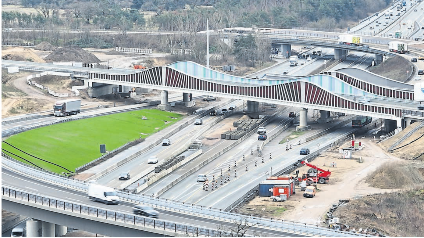
Das Zentralbauwerk am Darmstädter Kreuz wird in den kommenden Wochen verschoben. Das hat auch Auswirkungen auf den Verkehr.

In der ersten Sperrzeit wird laut der Autobahn GmbH der Verschiebung des Brückenersatzneubaus Zentralbauwerk Süd über die Fahrbahn vom Mittelstreifenpfeiler bis zur östlichen Widerlagerseite durchgeführt. Die Fahrbeziehungen der A5 und A67 aus Norden kommend in Fahrtrichtungen Mannheim und Basel seien davon zunächst nicht betroffen und würden weiterhin befahrbar bleiben.