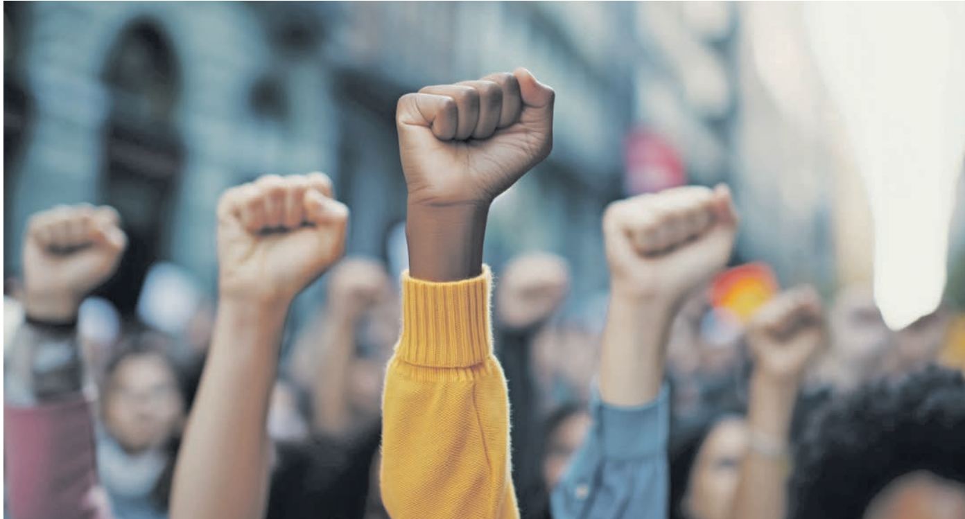
Der scheinbar grenzenlosen Macht des Kapitals wollten sozialdemokratisch orientierte Politikerinnen und Politiker im 20. Jahrhundert mit wirtschaftsdemokratischen Maßnahmen begegnen. Gewerkschafter wie der Verdi-Chefökonom Dierk Hirschel halten das Konzept auch heute noch für notwendig.

Mit dem Untergang des sowjetischen Sozialismus und dem Siegeszug von „New Labour“ unter Tony Blair wurden auch in der westlichen Sozialdemokratie sämtliche Konzepte zur Überführung wirtschaftlichen Privateigentums in gemeinschaftliche Hände ad acta gelegt. Beispielhaft zeigt sich dies in einer innerdeutschen Debatte aus dem Jahr 2003, damals wollte der sozialdemokratische Bundeskanzler Gerhard Schröder gemeinsam mit Olaf