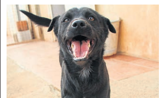
Vela, kleine süße, junge Hündin, 8kg, 42 cm sucht ein schönes Zuhause. www.Tierschutzverein-Santorini.de