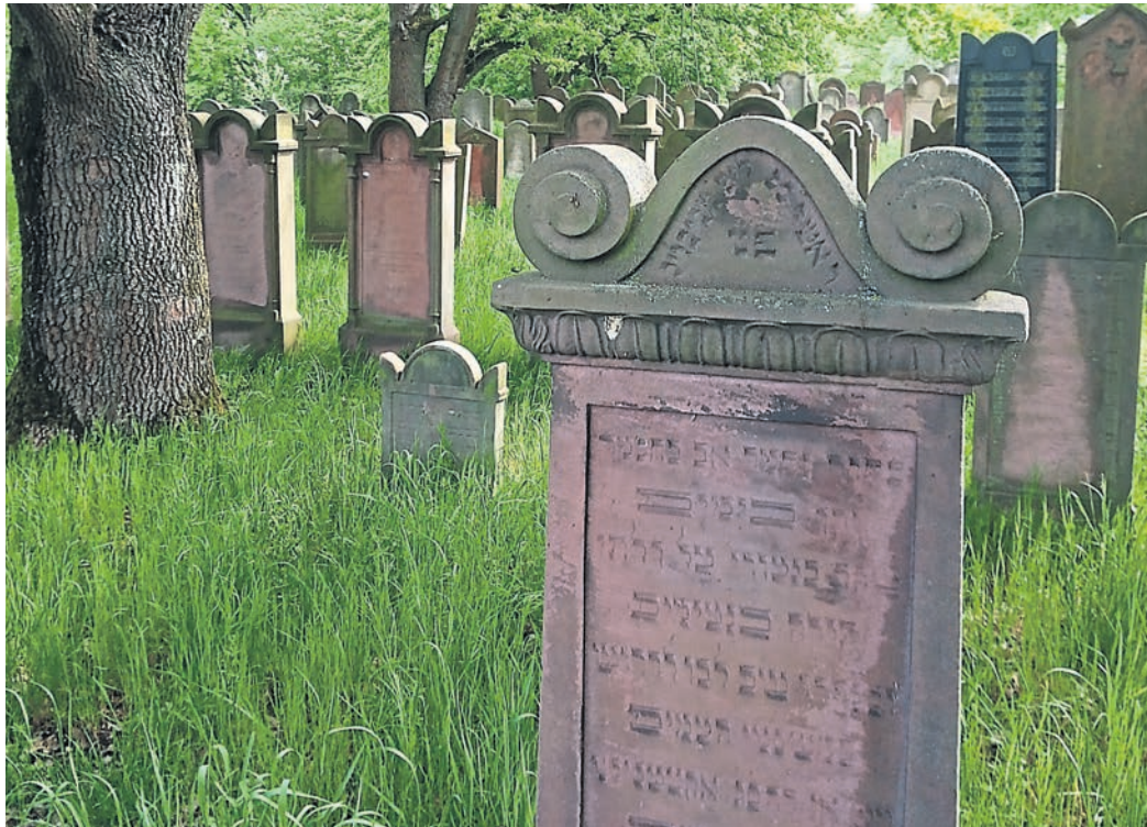
Mit über 2100 Grabsteinen ist der jüdische Friedhof in Alsbach der größte jüdische Landfriedhof in Hessen. Auch Juden aus Bensheim, Schönberg, Auerbach, Zell, Schwanheim und Lorsch fanden dort ihre letzte Ruhe.

Die orthodoxe Gestaltung des Friedhofs zeigt sich auch an der Art und Weise, wie die Grabsteine gestaltet wurden. „Nach dem Tod sind in der jüdischen Religion alle Menschen gleich. Das sollte sich auch in der Gestaltung der Gräber zeigen. Vor allem im älteren Bereich sind die Grabsteine relativ ähnlich gestaltet. Die Auswahl der Zierelemente war begrenzt, eine Einfassung des Grabes fand nicht statt. Unterschied-