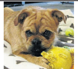
Leon, Mischling, 4 J., 7 kg, super lieb, klug, verschmüsst und sehr verspielt. www.Tierschutzverein-Santorini.de