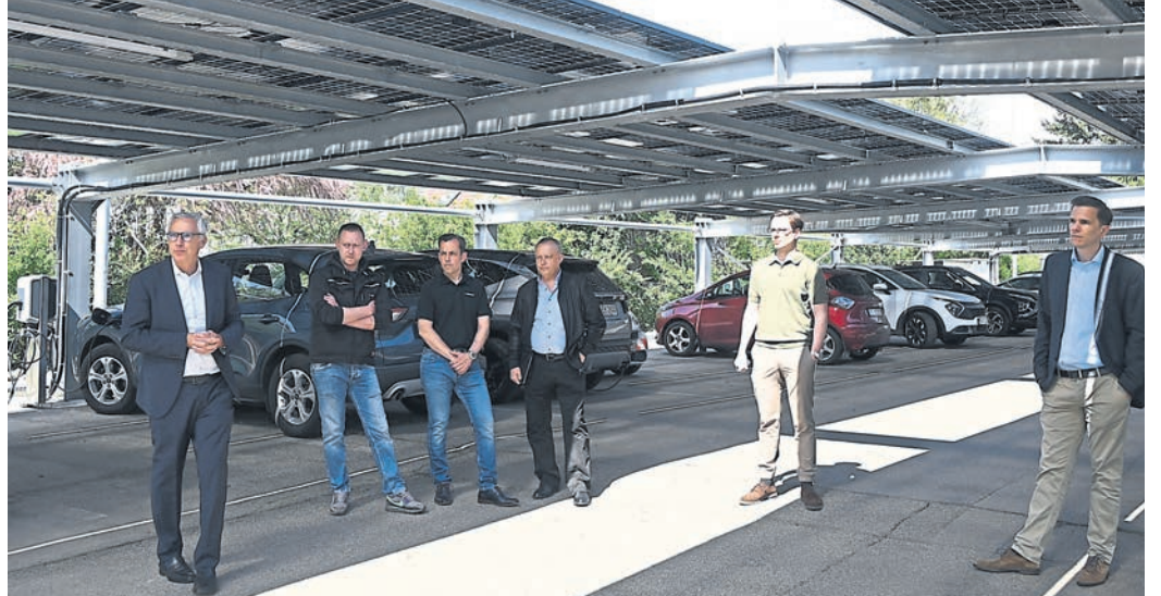
Die GGEW hat auf ihrem Parkplatz ein Dach, bestehend aus Photovoltaikmodulen, errichtet.

Neue Photovoltaikanlage offiziell eingeweiht