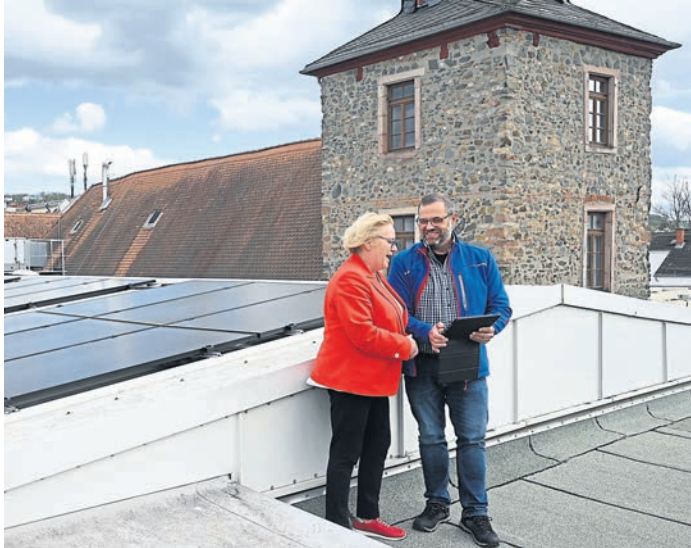
Auf dem Bensheimer Parktheater produziert nun eine PV-Anlage Strom.

Bensheim (mic). Nach der Großanlage auf dem GGEW-Mitarbeiterparkplatz (siehe gesonderten Bericht), hat Bensheim nun auch auf einem weiteren öffentlichen Gebäude eine solche Anlage installiert. So hatte die Stadt am Montag zu einem Besichtigungstermin auf das Dach des Parktheaters eingeladen. Hier produzieren seit Jahresbeginn 60 Module Strom für den Bensheimer Kulturtempel. Die Anlage liefert bei idealen Bedingungen 24 Kilowattpeak. Diese hat ein Investitionsvolumen von knapp 80.000 Euro und sie soll helfen, die beim Theaterbetrieb entstehenden Stromkosten langfristig zu senken. Um den