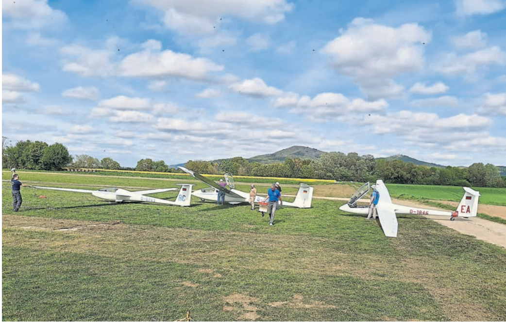
Die Bensheimer Segelflieger hatten kürzlich ihre Flugkolleginnen und -kollegen aus Reinheim zu Gast.

Segelflieger starten in die Saison / Besuch aus Reinheim