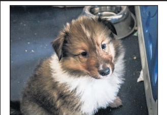
Collie-Welpen mit Pap., geimpft, entw., gechipt, Gesundheitszeugnis, kennen Katzen, idealer Fam.-Hund, 1.500,00€. ☎ 0178/6341666