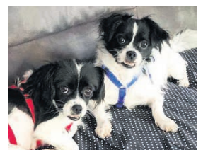
Sam & Minu, zwei süße, kluge kleine Hunde suchen ein schönes Zuhause. www.Tierschutzverein-Santorini.de