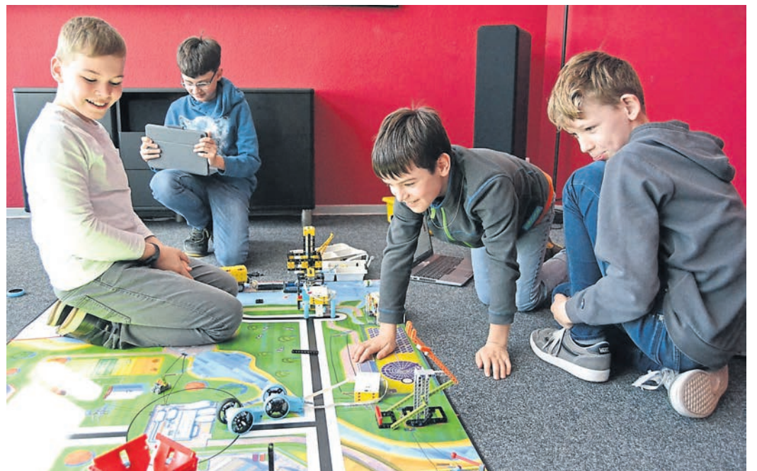
Beim Robotik-Workshop im JUZ in Bensheim hatte der technikbegeisterte Nachwuchs jede Menge Spaß.

Bensheim (red). Mit den Bausteinen von Lego lassen sich Welten erschaffen – und Roboter programmieren. „Der Kreativität sind in beiden Fällen keine Grenzen gesetzt. Das zeigte sich kürzlich beim Osterworkshop der Jugendförderung im Bensheimer Jugendzentrum in Kooperation mit dem digi_space des Kreises Bergstraße“ berichtet die Stadt Bensheim in einer Pressemeldung. „Dort hauchten die jungen Teilnehmenden ihren Kreationen Leben ein.“ „Wir wollen die Ferien nutzen, um auch Jüngeren ein zusätzliches Angebot unterbreiten zu können“, erklärte Markus van den Boom, Leiter des Jugendzentrums. Bereits im vergangenen Jahr konnten Schülerinnen und Schüler Lego-Roboter programmieren. Die Wiederholung seien nun ebenfalls auf großes Interesse gestoßen.