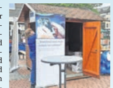
Der VdK auf dem Markt.

Stand auf dem Marktplatz – Sozialverband hat Sozialpolitik im Blick Die Teilnahme am Frühlingssonntag ist für den VdK, der allein in Griesheim eine vierstellige Mitgliederzahl betreut, bereits Tradition und fester Bestandteil im Jahreskalender. In diesem Jahr wird am Marktplatz vertreten sein und über die aktuelle Sozialpolitik, anstehende Aktio- nen und Vorträge sowie zum Schwerpunktthema „Pflege“ informieren. Der Sozialverband ist mit 2,1 Millionen Mitgliedern der größte Deutschlands. Er vertritt sozialpolitische Interessen und setzt sich für einen starken Sozialstaat, eine tragfähige gesetzliche Sozialversicherung und soziale Gerechtigkeit ein. mwi