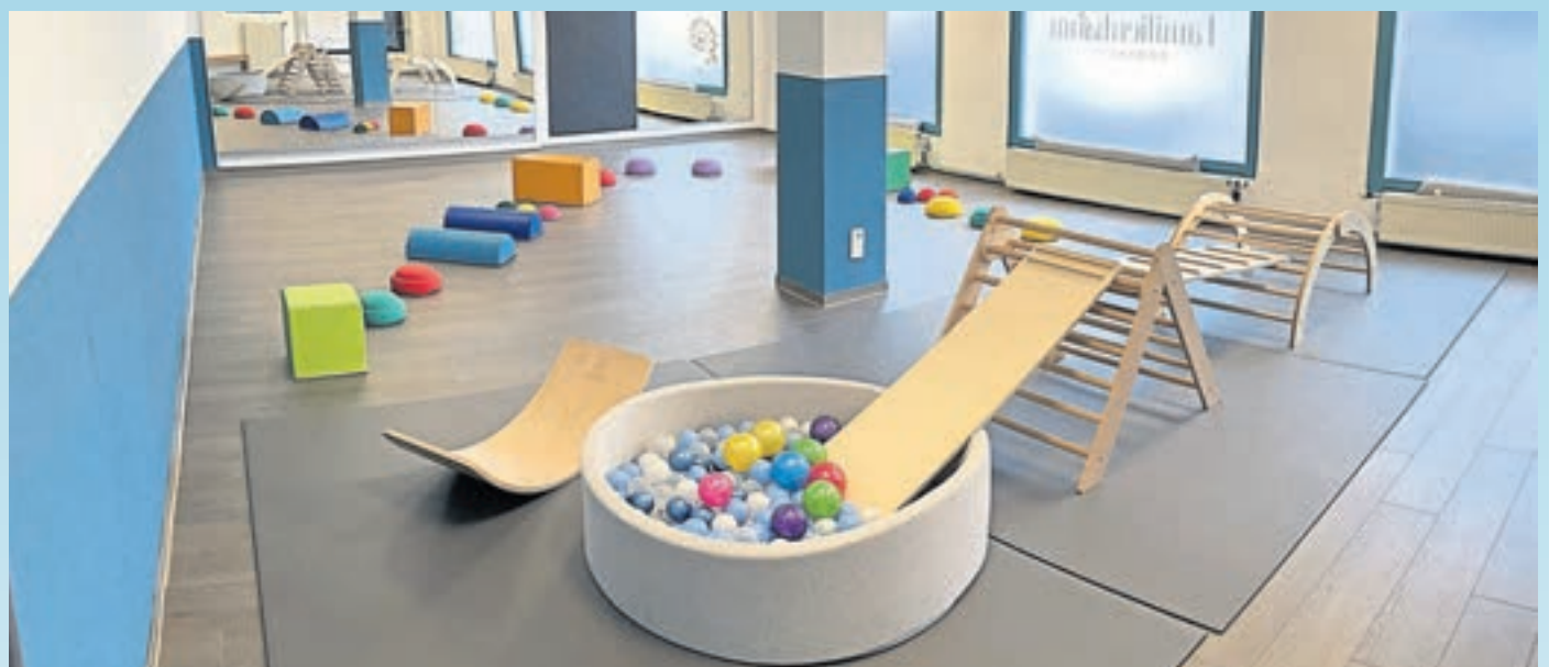
Im Kursraum von Familientraum werden am Frühlingssonntag verschiedene Kurse vorgestellt.