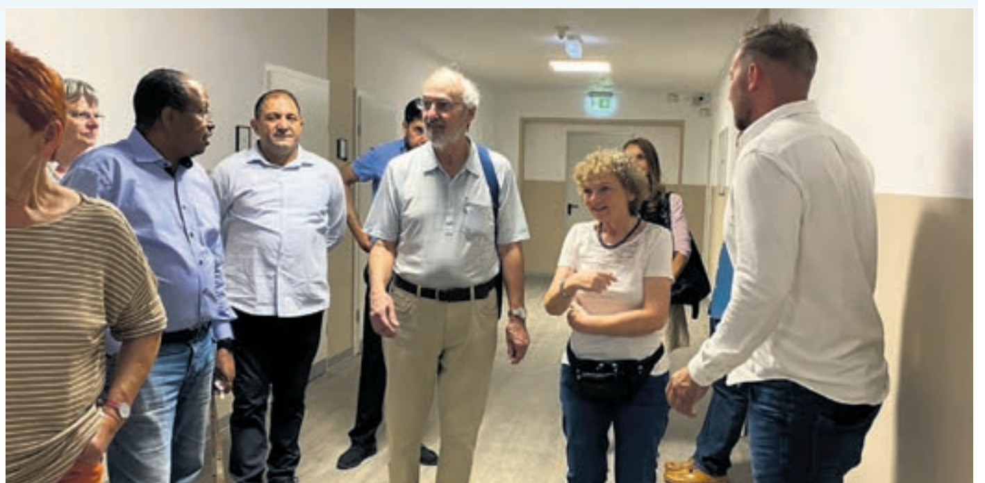
Der Arbeitskreis Asyl setzt sich für geflüchtete Menschen ein und sucht mit ihnen eine geeignete Bleibe. Unser Foto zeigt die Begegnung einer Unterkunft in der Bunsenstrasse.

Im Innenhof des Familientraums wird es die Möglichkeit geben, an vereinzelten Ständen handgemachte Besonderheiten aus Griesheim zu erwerben und lokale Hersteller zu unterstützen. Besucher können also nicht nur von den kostenlosen Kursangeboten profitieren, sondern auch aktiv den lokalen Handel am Frühlingssonntag unterstützen. jp