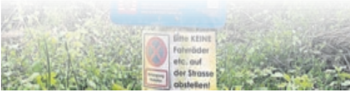
Der Angelsportverein ist im Naturschutzgebiet angesiedelt und muss immer mehr Vorgaben berücksichtigen.

Die Obere Naturschutzbehörde habe nach einem Vorort-Termin den Anglern die Vorgabe gestellt, dass in unmittelbarer Nähe rund um die Teiche und das Gelände keine Fahrräder mehr abgestellt werden dürfen. Somit müssen die Angler 200 Meter vor dem Gelände einen gesonderten Fahrradparkplatz errichten und ausweisen. Außerdem dürfen keine Autos mehr in Richtung Naturschutzgebiet fahren, hierfür werde eine Sperrung direkt an der B26 eingerichtet, und die Bollwagen-Gruppen müssen ihre mitgebrachten Musikboxen vor dem Gelände ausschalten. Eines der