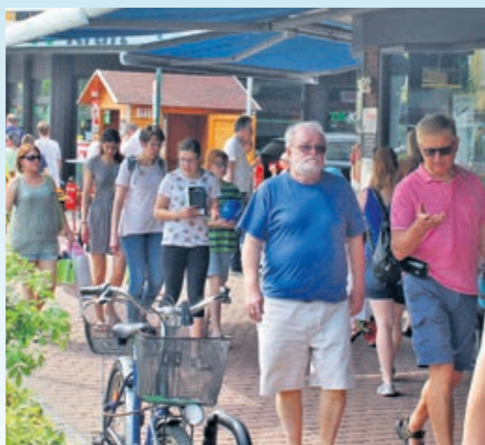
Entspanntes Einkaufen am verkaufsoffenen Frühlingssonntag.

Wenn die Wilhelm-Leuschner-Straße in der Innenstadt für den Verkehr gesperrt ist und vom Marktplatz bis zur Georg-Schüler-Anlage Zelte stehen, dann haben die Griesheimer etwas zu feiern. Am Frühlingssonntag ist es wieder soweit: Der Gewerbeverein und die Stadt Griesheim laden ein, es sich bei Speis und Trank gut gehen zu lassen sich dabei über die Griesheimer Geschäftswelt, die Angebote der Stadt Griesheim und vielem mehr zu informieren. Auch einige Geschäfte auf der Ladenzeile, der Familienraum in der Hintergasse und Fahrrad XXL in der Flughafenstraße haben an diesem besonderen Sonntag für ihre Kunden geöffnet.