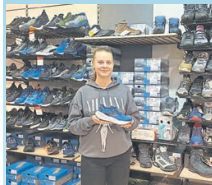
Welcher Schuh darf es sein? Bei Sport Ebli gibt es eine große Auswahl an unterschiedlichsten Sportschuhen. mw-foto