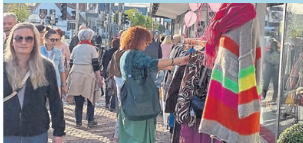
Auch die Geschäfte auf der Griesheimer Ladenzeile laden am Frühlingssonntag ein. Dabei darf im abwechslungsreichen Angebot gestöbert werden und das eine oder andere Schnäppchen geschlagen werden.