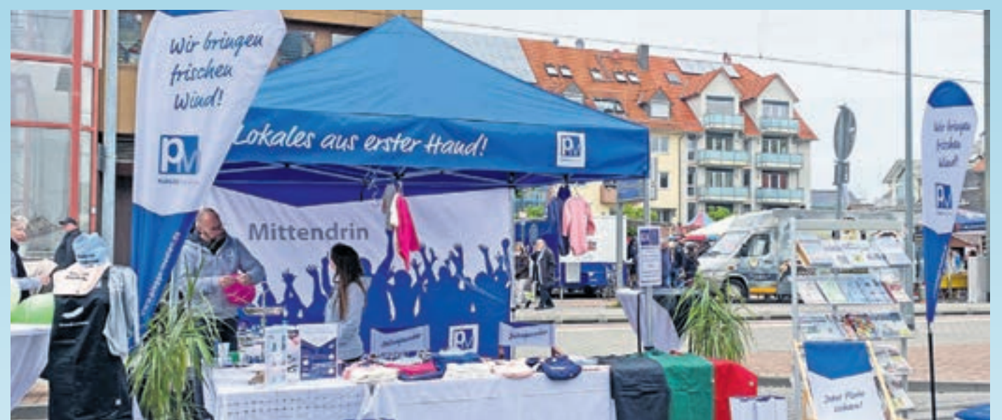
Mittendrin. Auch der „Griesheimer Anzeiger“ präsentiert sich wieder beim verkaufsoffenen Frühlingssonntag in der Innenstadt und lädt alle ein, vorbeizukommen, sich zu informieren, mitzumachen und einen Ballon mitzunehmen.