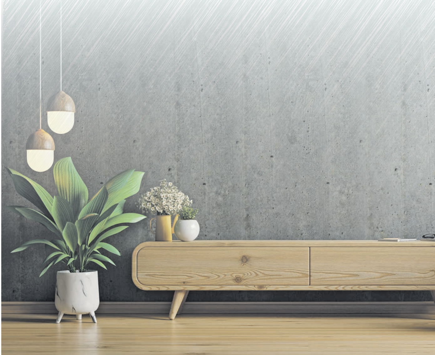
Parkett und Holzdielen sind besonders nachhaltige Bodenbeläge, da sie zu 100 Prozent aus einem nachwachsenden Rohstoff bestehen.

Trend bei neuen Bodenbelägen bietet viele Möglichkeiten