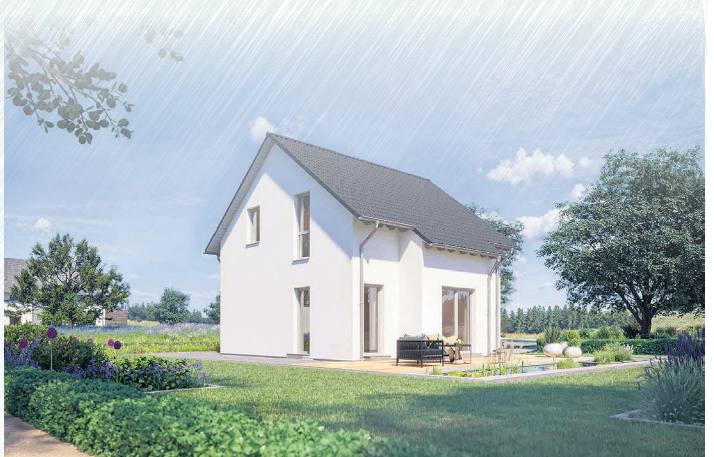
Das komfortabel geschnittene Aktionshaus verfügt über eine vorteilhafte Dachneigung und einen Kniestock, der für zusätzlichen Raum im Obergeschoss sorgt.

Von massa haus etwa gibt es für unter 110.000 Euro als Aktionshaus ein 111 Quadratmeter großes Familienhaus. Es ist fertig gedeckt und weiß verputzt, alle Fenster und Türen sind verbaut. Highlights sind der große Erker mit breiter Terrassentür, farbiger Dach-