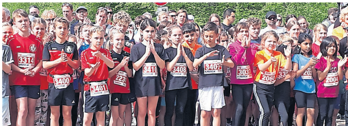
Gespannt warteten die 95 Kinder am Start des Schülerlaufs. Die Leichtathletik-Abteilung des TuS war hierbei mit 17 Schülern vertreten.