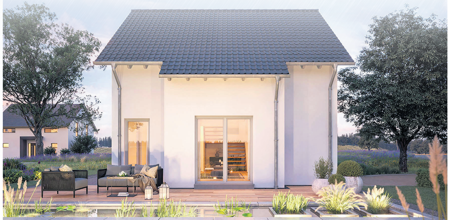
Ein sogenanntes Aktionshaus wird wie abgebildet auf einer Bodenplatte oder einem Keller geliefert. Die grauen Ziegel und folierte Fensterrahmen sind im Lieferumfang enthalten.

bis zum Einzug fallen ausschließlich im Inneren des Hauses an - das macht den Bau wetterunabhängig. Die Eigenleistungen der Baufamilie werden bei der Baufinanzierung als Eigenkapital anerkannt. Viele Familien übernehmen Trockenbau, Fußbodenbeläge sowie Maler- und Tapezierarbeiten selbst. Mit etwas handwerklichem Geschick können auch Heizungs- und Klempnerarbeiten in Eigenregie erfolgen. djd