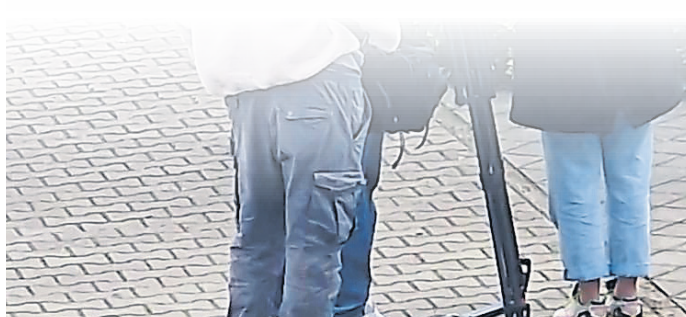
Dreharbeiten für die Fernsehshow Shopping Queen. Der Sendertermin ist noch nicht bekannt.

show, in der die Teilnehmerinnen ein Outfit zu einem bestimmten Thema zusammenstellen und sich im Anschluss daran von ihren Konkurrentinnen bewerten lassen, ihre 2500. Folge. Moderator und Modedesigner Guido Maria Kretschmer kommentiert dabei jeden Shopping-Tag der Frauen und lässt zum Abschluss ebenfalls eine Bewertung mit in das Gesamtergebnis einfließen.