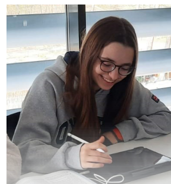
Die Vorbereitungszeit ist fast vorbei. Auch an der GHS star-

Mit dem Ende der dreiwöchigen Osterferien in Hessen hat am Montag die Schule wieder begonnen. Für die Abiturienten geht es jetzt in die heiße Phase. Die schriftlichen Abiturprüfungen finden im Zeitraum vom 17. April bis 8. Mai, die Nachprüfungen vom 21. Mai bis 6. Juni statt. Den Start machen am Mittwoch die Leistungskurse Kunst, Musik, Politik und Wirtschaft, Geschichte, Wirtschaftswissenschaften, Erdkunde, evan-