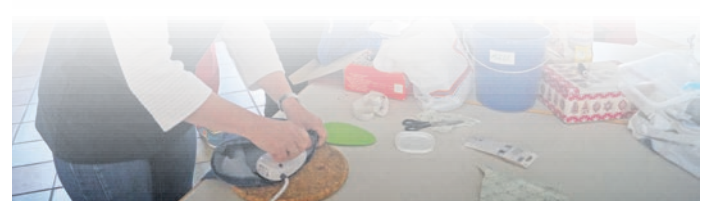
Ob in der Nähstube oder in der Fahrradwerkstatt, die Experten des Repaircafés sind mit vollem Einsatz dabei.

www.plegge-medien.de/service/abonnentenservice