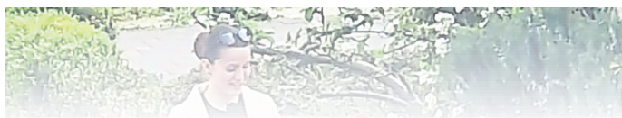
Der Sendertermin ist noch nicht bekannt.

wann die Sendung ausgestrahlt wird und ob es nur eine Griesheimer Kandidatin gibt, darauf antwortete die Pressestelle der Produktionsfirma bis Reaktionsschluss noch nicht.