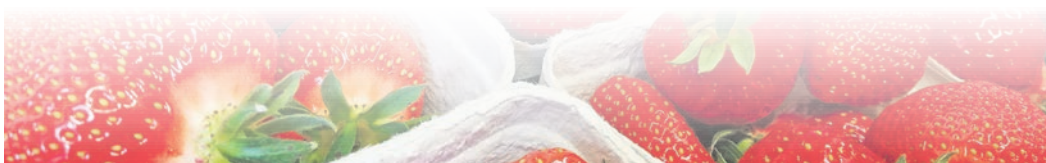
Rote Erdbeeren. Diese sind ab Mittwoch dieser Woche wieder im Hofladen der Familie Mönich erhältlich.

www.plegge-medien.de/service/abonnentenservice