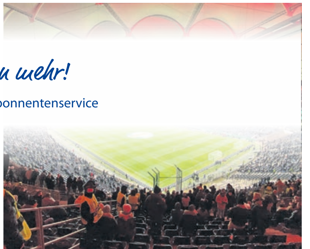
Die Frankfurter Eintracht empfing am Ostersonntag Union Berlin im Deutsche Bank Park. Die beiden Mannschaften trennten sich 0:0.

Ende hat der letzte Punch gefehlt, den Ball mit egal welchem Körperteil über die Linie zu drücken. Defensiv war das sehr ordentlich, offensiv haben wir gegen einen tiefstehenden Gegner sehr viele Situation kreiert. Ich sehe das Positive, wir haben einen Schritt nach vorne gemacht, gute Spielfreude und gutes Engagement gezeigt. Das Quäntchen Glück hat gefehlt. Union hat gute Qualität im Verteidigen gezeigt“, so Eintrachts Trainer Dino Toppmöller. jp