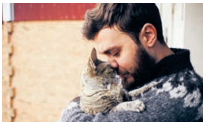
Auch beim Schmusekätzchen gilt: Je früher eine Krankheit erkannt wird, desto besser kann geholfen werden.