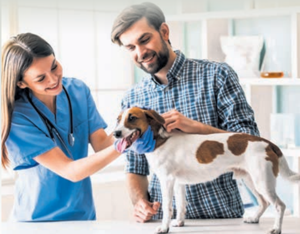
Vorsorgeuntersuchungen und -maßnahmen sollten nicht aus finanziellen Gründen unterlassen werden, denn am Ende wird die Behandlung dann meist noch teurer oder kommt gar zu spät. Auch bei der Vorsorge kann eine Tierkrankenversicherung für Entlastung sorgen.

Allgemein kann man zwischen einem Vollschutz und einer reinen OP-Versicherung unterscheiden. "OP-Kostenschutz-Tarife erstatten in der Regel nur Kosten, die für eine Operation des Hundes oder der Katze anfallen, also für chirurgische Eingriffe unter Narkose", erklärt