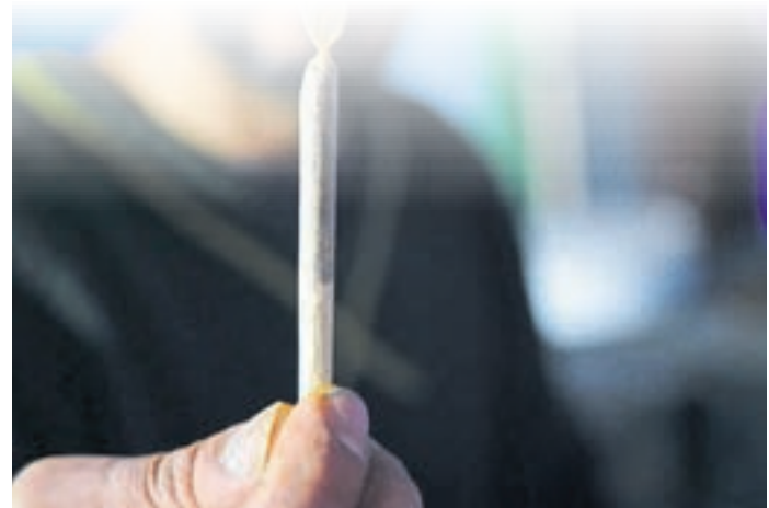
Das Rauchen von Cannabis ist jetzt legal.

Vor Ort war auch der YouTuber Klimpel, der den Partygängern rund um das Brandenburger Tor anbot, den THC-Gehalt ihres Cannabis festzustellen. Dafür hatte er ein mobiles Testgerät dabei, das Licht auf die Probe strahlte und das zurückgestrahlte Licht