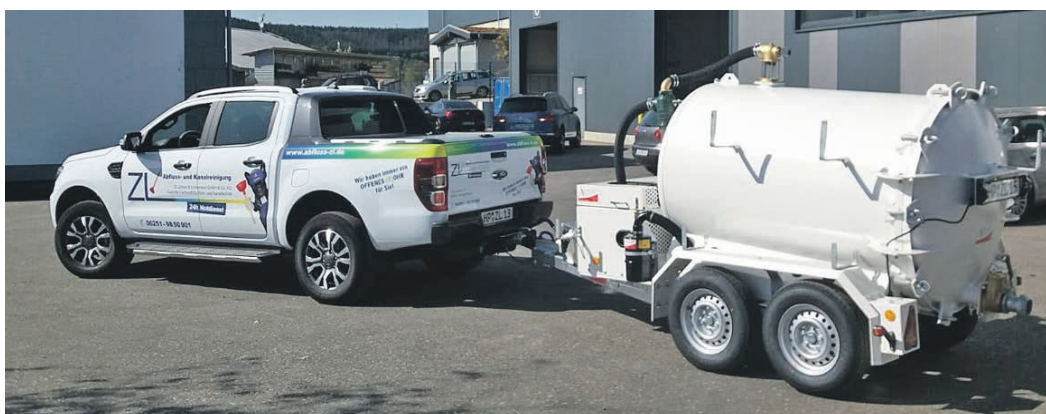
Zum Reinigen von Zisternen gibt es bei „Zirkler und Lindemann“ einen Sauganhänger, der aufgrund kompakter Abmessungen auch gut für Einsätze in beengten Verhältnissen geeignet ist.

unsere starke Mannschaft ginge hier nichts“, sind sich die beiden Gesellschafter sicher. Die Auftragslage ist gut. Zirkler und Lindemann investieren fort-