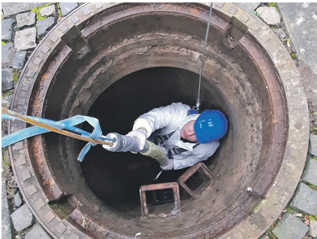
Der Beruf des Umwelttechnologien beziehungsweise der -technologin für Rohrleitungsnetze und Industrieanlagen hält außergewöhnliche Einsatzorte bereit.