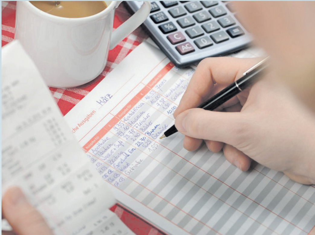
Wie viel geht monatlich für Energiekosten, Lebensmittel oder Versicherungen drauf? Ein Haushaltsbuch verschafft mehr finanzielle Klarheit und somit auch psychische Ruhe.

Die Ausgaben ausschließlich nach Gefühl zu steuern, ist keine gute Idee. Denn die Unsicherheit, ob das Geld bis zum Monatsende reicht, geht mit der Zeit an die eigene Substanz und belastet die Psyche, sagt Korina Dörr, Leiterin des Beratungsdienstes Geld und Haushalt: „Die beste Methode dagegen ist das Aufschreiben der Einnahmen und Ausgaben, um zu mehr Transparenz und da-