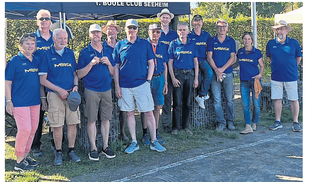
Der Boule-Club Seeheim spielt künftig in der Zweiten Hessenliga – ein neues Kapitel in der Vereinsgeschichte des Seeheimer Vereins.

Boule-Club Seeheim spielt künftig in Zweiter Hessenliga