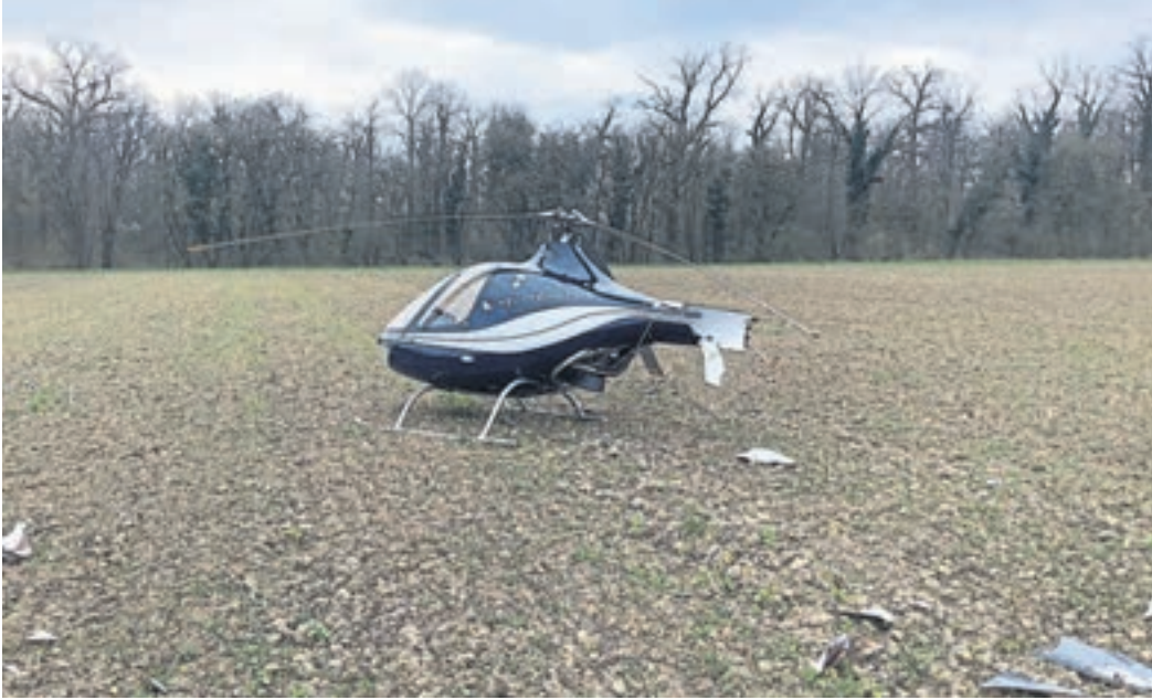
Der abgestürzte Hubschrauber nahe Klein-Rohrheim. Die beiden Insassen konnten die Maschine glücklicherweise unverletzt verlassen.

Klein-Rohrheim (red/nic). Am vergangenen Mittwoch, 6. März, kam es gegen 15 Uhr auf einem Feld zwischen der Bundesstraße 44 und der Autobahn 67 bei Klein-Rohrheim zu einem Absturz eines Hubschraubers. Laut Angaben der Polizei befanden sich zum Zeitpunkt des Absturzes zwei Männer in der Maschine, die unverletzt blieben und sich anschließend selbstständig aus dem Hubschrauber retten konnten. Zu den Ursachen für den Absturz sowie den Unfallhergang konnte die Polizei bislang keine Angaben machen. Ersten Vermutungen zufolge stürzte die Maschine, bei der es sich weder um einen Rettungs- noch um einen Polizeihubschrauber handelte, aufgrund des Schadensbilds mutmaßlich aus geringer Höhe ab. So ist auf ersten Bildern von der Unfallstelle erkennbar, dass zwar unter anderem der Heckausleger der Maschine abgebrochen ist, das Cockpit jedoch weitestgehend unverletzt blieb. Wie die Polizei mitteilt, wurden direkt mehrere Einsatzkräfte zur Unfallstelle gerufen und die Bundesstelle für Flugunfalluntersuchung umgehend nach dem Absturz informiert. Diese habe bereits die Ermittlungen zur