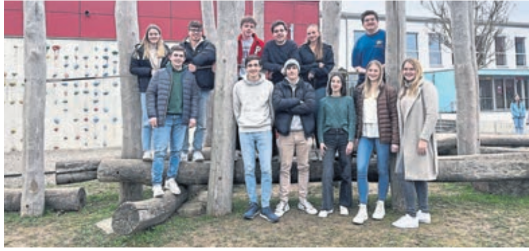
Das Abiballkomitee des aktuellen Abiturjahrgangs des Gernsheimer Gymnasiums freut sich auf einen stimmungsvollen Abend in der Christoph-Bär-Halle.

Zwischen Party und Prüfungen: Das VoFi-Komitee des Gernsheimer Gymnasiums im Gespräch