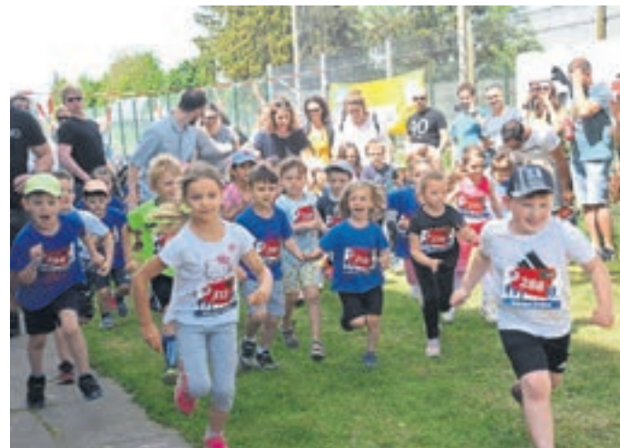
Auch in diesem Jahr organisiert der TV den Ortslauf wieder ausschließlich für Kinder und Jugendliche.

Groß-Rohrheim (mic). Groß-Rohrheims Veranstaltungs- und Kulturangebot stand auf der Tagesordnung der jüngsten Sitzung des Groß-Rohrheimer Sport- und Kulturausschusses. Zunächst ging es jedoch um die drei Ortseingangsschilder. Sie sind in die Jahre gekommen und sollen erneuert beziehungsweise repariert werden. Auch die eigentlichen Schilder, die die Besucherinnen und Besucher willkommen heißen, sollen gegen neue ausgetauscht werden. Die Verwaltung hatte dem Ausschuss drei unterschiedliche Motive zur Beratung mitgebracht. Auf allen drei Schildern steht in verschiedenen Schriftzügen „Herzlich Willkommen in Groß-Rohrheim“. Nach kurzer Beratung überzeugten alle drei Vorschläge die Ausschussmitglieder nicht. Vor allem die Fotocollage (Schule, Rathaus, beide Kirchen) wollte bei keinem überzeugen. Bis zur nächsten Sitzungsrunde soll eine überarbeitete Version des Hauptmotivs vorliegen. Länger diskutiert wurde auch über das Standgeld bei den drei großen Veranstaltungen Maimarkt, Nikolausmarkt und Kerb. „Es wäre sinnvoll das ganze transparenter zu