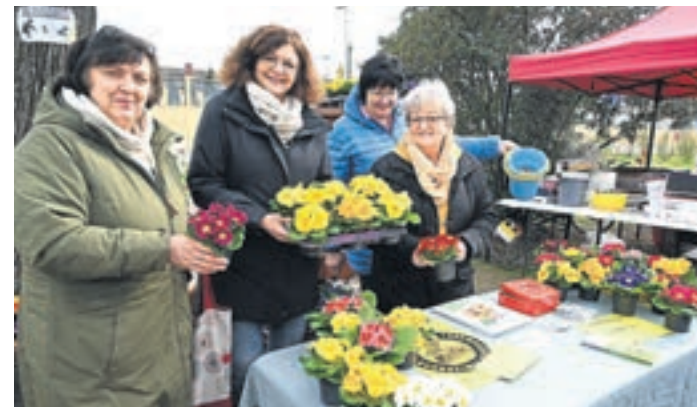
Am Infostand des Bauernmarkt-Teams gab es Töpfe mit Primeln zu gewinnen. Parallel zum Bauernmarkt fand außerdem ein Flohmarkt für Kindersachen statt.