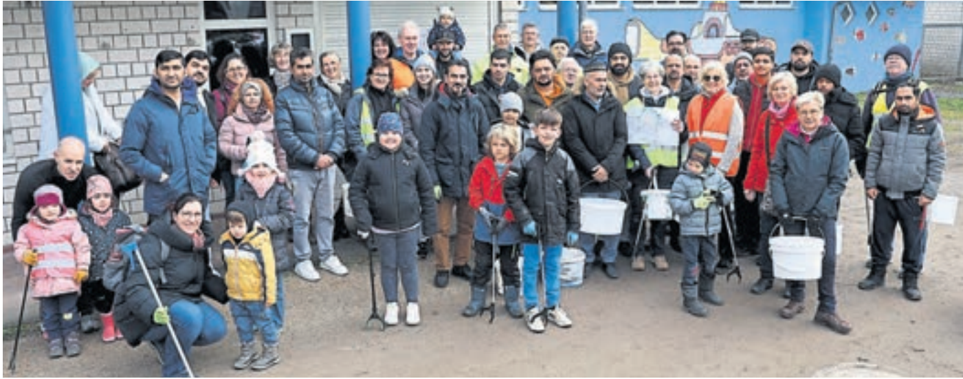
In ganz Riedstadt befreiten am vergangenen Samstag jede Menge Freiwillige die Umgebung von herumliegendem Unrat. In Goddelau waren insgesamt 48 Personen unterwegs. In haza-foto

Freiwillige sammeln viel Müll bei Aktion „Sauberes Riedstadt“