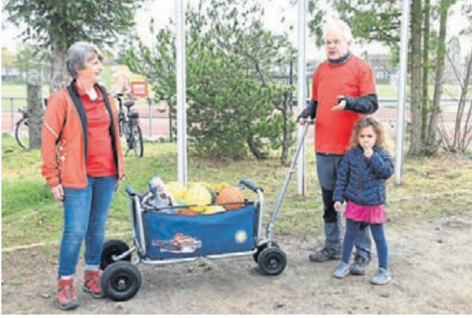
Im Rahmen des „Fit in den Frühling“-Events wurde beim TuS auch das Outdoorpaket vom Landessportbund Hessen ausgiebig getestet.

„Vom Start weg orientierte man sich an den Ausschilderungen und folgte den Pfeilen an Wegekrenzungen und Gabelungen. Leider hatten