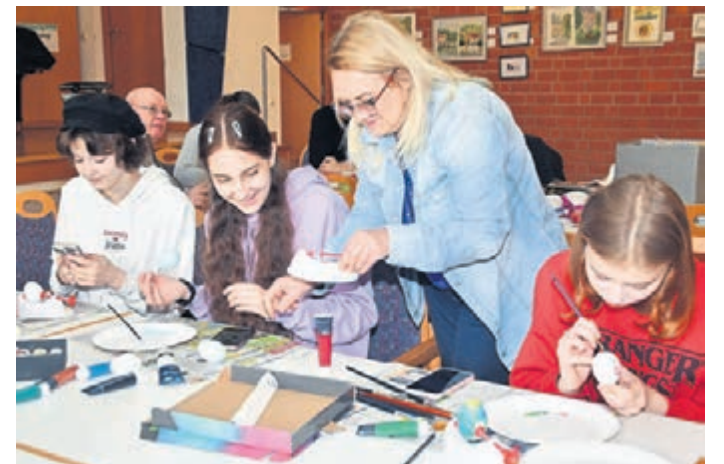
Griesheim (gu). Gemeinsam mit dem Seniorenbüro der Stadt Griesheim lud der Griesheimer Kulturverein zu einem generationsübergreifenden österlichen Bastelnachmittag in den Pavillon des Hauses Waldeck ein. In lockerer Atmosphäre konnten Jung und Alt bei der Herstellung von Osterdekorationen ihre Kreativität entfalten. Unterschiedliche Angebote vom Basteln mit Papier und Schere bis hin zu Eierfärben mit Tauchlack machten Lust auf Ostern.