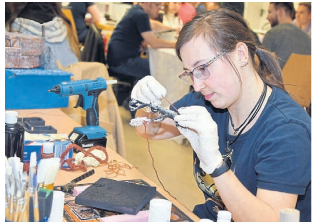
Im Rahmen des Rollenspieltags wurden auch verschiedene Workshops angeboten – unter anderem zum Gelände- und Dungeon-Bau.

alle Tische besetzt waren. Die Gruppenleiter hatten unterschiedliche Abenteuer vorbereitet und stellten verschiedene Regelwerke vor. Es wurden Spielrunden in den Systemen Mutant, Cy_Borg, Ratten!, Starfinder, Mausritter und Dungeons & Dragons 5.0 angeboten. Zusätzlich gab es Workshops zum Gelände- und Dungeon-Bau sowie für „Floating Dices“, an denen interessierte Spieler teilnehmen konnten.