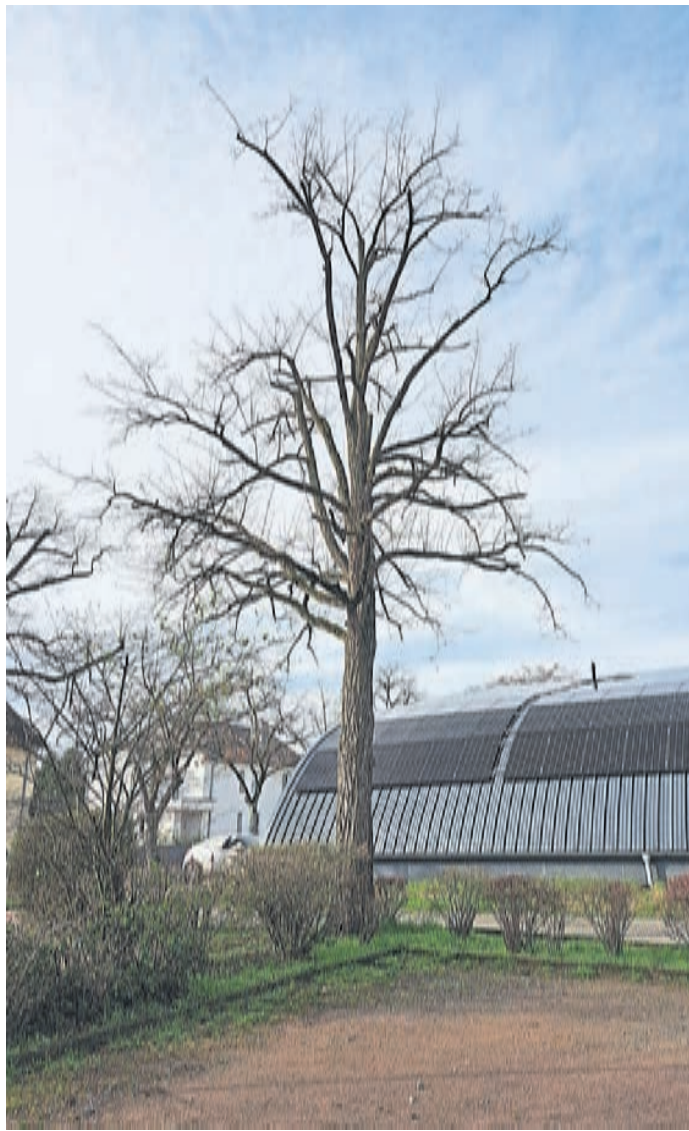
Weil die rund 30 Jahre alte Scheinakazie am Parkplatz Parsevalstraße schon krank sei und eine neue Trafostation errichtet werden soll, muss sie nach Mitteilung der Stadt Griesheim gefällt werden.

„Im Bereich des gefällten Baumes wird die E-Netz Süd-hessen eine neue Trafostation errichten. Diese soll zum einen zu einer besseren allgemeinen Stromversorgung beitragen und zum anderen dem TuS Griesheim die Möglichkeit bieten, den auf seinen vier Hallendächern mit Photovoltaik erzeugten Strom in das bestehende Netz einzuspeisen“, heißt es in der Meldung weiter. Die Wahl des zu fällenden Baumes fiel auf die Scheinakazie, da diese bereits von Fäule im Stammfuß befallen sei und im Kronenbereich eingekürzt werden musste. Um die Verkehrssicherheit auf dem Parkplatz weiterhin zu gewährleisten und ein Umstürzen des Baumes auf angrenzende Gebäude zu verhindern, beseitigen die städtischen Bauhof-Mitarbeiter der Abteilung Grün-pflege die Scheinakazie. „Noch in diesem Jahr folgt an anderer Stelle auf dem Parkplatz eine Ersatzpflanzung“, heißt es in der Meldung der Stadt Griesheim abschließend.