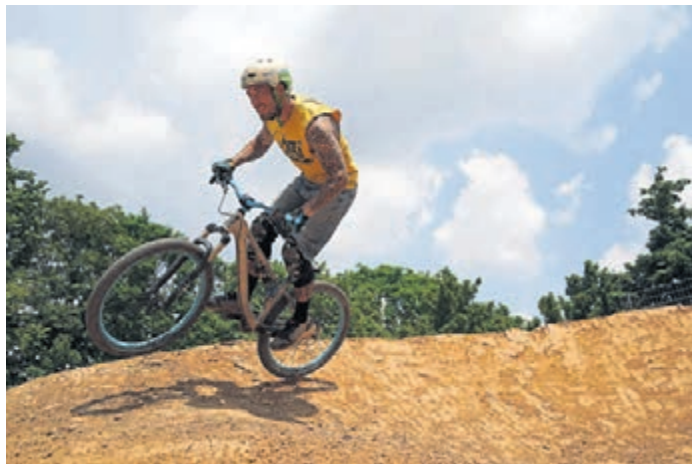
Am Dienstag, dem zweiten Ferientag, startet offiziell die Saison auf der Dirtbikestrecke. Dazu lädt die Jugendförderung ab 14 Uhr auf das Gelände ein.

Griesheim (red). Die Jugendförderung der Stadt Griesheim hat für Kinder und Jugendliche, die in den Osterferien nicht in den Urlaub fahren oder zu Hause Langeweile haben, wieder ein actionreiches Programm auf die Beine gestellt. In der ersten Woche steht am Dienstag, 26. März, der Saisonbeginn auf der Dirtbikestrecke an. Los geht es um 14 Uhr, kleine Snacks und Getränke zur Stärkung werden vor Ort und in der Grillhütte Süd angeboten. Mit Einbruch der Dunkelheit wird die Veranstaltung spätestens um 20 Uhr beendet. Da die „Blue Box“ an diesem Tag geschlossen sein wird, finden für alle Interessierten ab der 4. Klasse bis 14 Jahre ein Ausflug in den Zoo Viarvarium Darmstadt vorgesehen. Die Anmeldung hierfür erfolgt über griesheim-