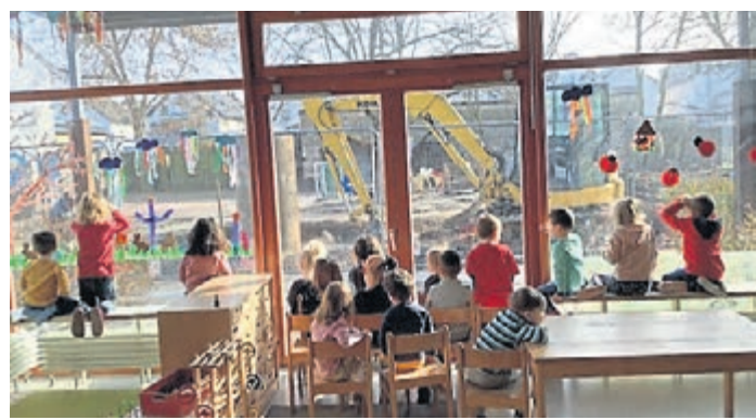
Spannung in den Räumen der Kita-Melanchthon: Der große Bagger im Garten ist so spannend, dass sich die Kita-Kinder die Nasen an den Fenstern plattdrücken.