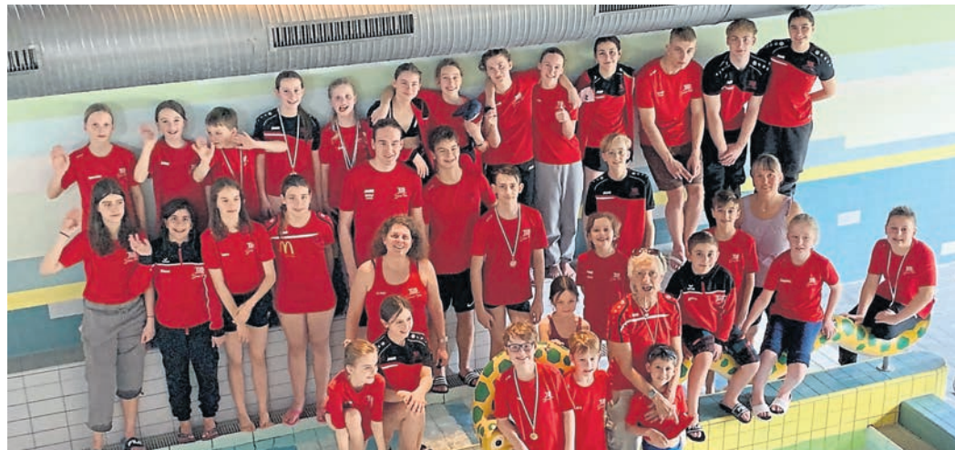
Die TuS-Schwimmerinnen und Schwimmer konnten sich zum Jahresauftakt über zahlreiche Erfolge freuen.

Griesheim/Viernheim (red). Den Schwimmerinnen und Schwimmern des TuS ist kürzlich ein erfolgreicher Start ins neue Jahr geglückt. Wie der Verein berichtet, war man unter anderem bei den Deutschen Mannschaftsmeisterschaften (DMS) in Viernheim und beim Einladunsschwimmen des SV St. Stephan am Start: Am 18. Februar fanden in Viernheim die DMS des Hessischen Schwimmverbands Süd statt. Mit insgesamt 27 Teilnehmenden reiste die TuS-Schwimmabteilung mit zwei Mannschaften an, um sich der Konkurrenz zu stellen. „Die Stimmung war wie erwartet super und das besondere Flair dieser Veranstaltung war überall zu spüren. Viele TuS-Kids waren zum ersten Mal bei den DMS dabei und die große Bandbreite der zu absolvierenden Distanzen ermöglichten auch den erfahrenen Schwimmern, die ein oder andere Streckenpremiere, so dass Groß und Klein ihren Starts entgegenfiebern“, berichtet die Schwimmabteilung.