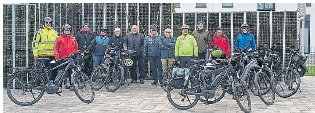
Die Dienstagsfahrer warfen beim Radhersteller „Riese & Müller“ einen Blick hinter die Kulissen.

Mitarbeiter aus über 50 Nationen Bauteilkomponenten aus der halben Welt zu Lastenrädern und E-Bikes“, berichten die Dienstagsfahrer. Nach einem kurzen Abstecher zum Werksverkauf ging es wieder nach Griesheim, wo man auf dem Markt bei einem Glas Wein den Tag ausklingen ließ.