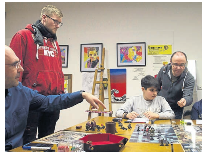
Die „Guards Gold & Magic“-Rollenspieler des Griesheimer Kulturvereins laden zu einem Schnuppertag im Bürgerhaus St. Stephan ein.

Weitere Infos: griesheimerkulturverein.de