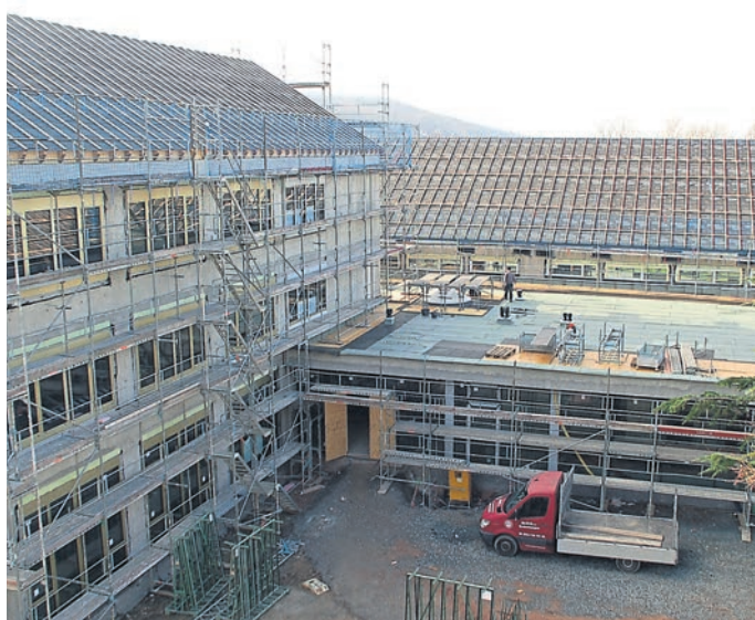
Die Bauarbeiten beim Forum am Rathaus machen sichtbare Fortschritte.

„Nachdem im vergangenen Jahr trotz mehrfacher Ausschreibungsverfahren kein Dachdecker für die Ausführung der Steildächer am Forum gefunden werden konnte und Notdächer als Schutz vor witterungsbedingten Schäden an der