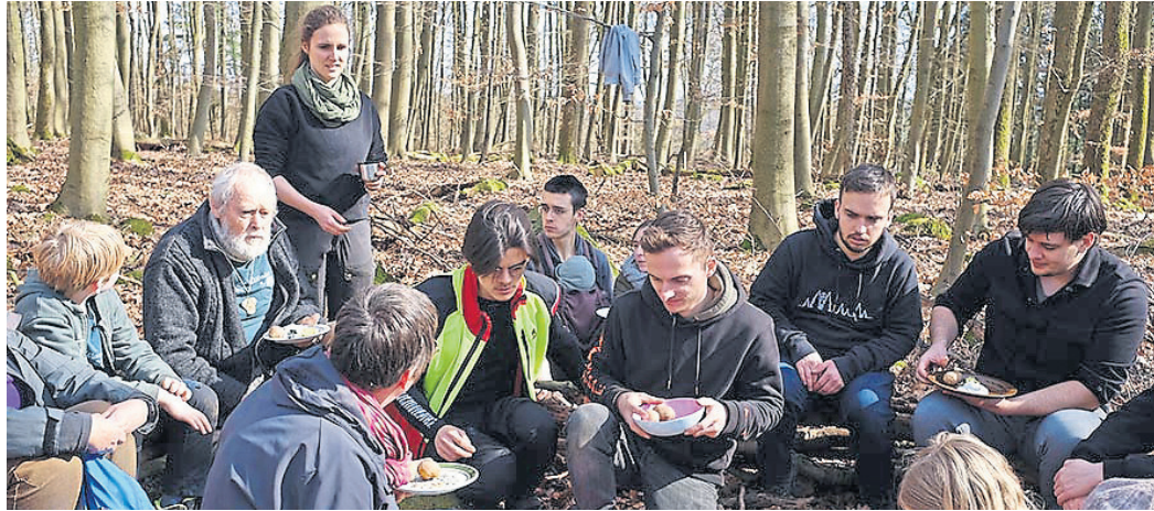
Nach getaner Arbeit belohnten sich die Teilnehmenden der Pflanzaktion an der Galgenbuche mit einem leckeren Essen.

Seeheim-Jugenheim (red). An der Galgenbuche, am südlichsten Gipfel des Langenberges, waren kürzlich die Wühlmäuse, die Real Life Guys und viele Seeheimer Bürgerinnen und Bürger zu einem Großeinsatz angetreten. „53 Erwachsene, Jugendliche und Kinder pflanzten Bäume, Sträucher und Blumen“, berichten die Wühlmäuse in einer Mitteilung an die Presse. „Außerdem wurden noch Blumen gesät.“ Viele Bäume bekamen eine schützende Umzäunung und ein größere Fläche wurde mit einem Hordengatter versehen. Ziel der Aktion sei die Förderung der Artenvielfalt. Es seien einheimische, standortgerechte Baumarten gepflanzt worden, die es im Gebiet und seiner näheren Umgebung nicht gebe. Darunter seien Spitzahorn, Elsbeere und Eibe gewesen.