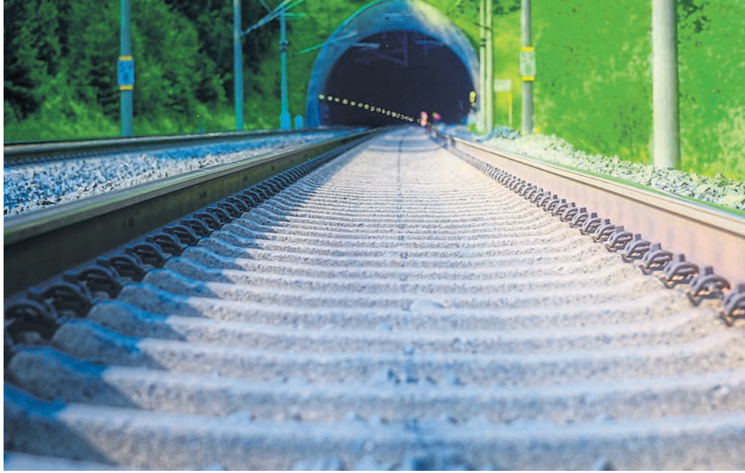
Die neue ICE-Strecke zwischen Frankfurt und Mannheim sieht unter anderem einen Tunnel vor, der von Lorsch bis nach Mannheim reichen soll.