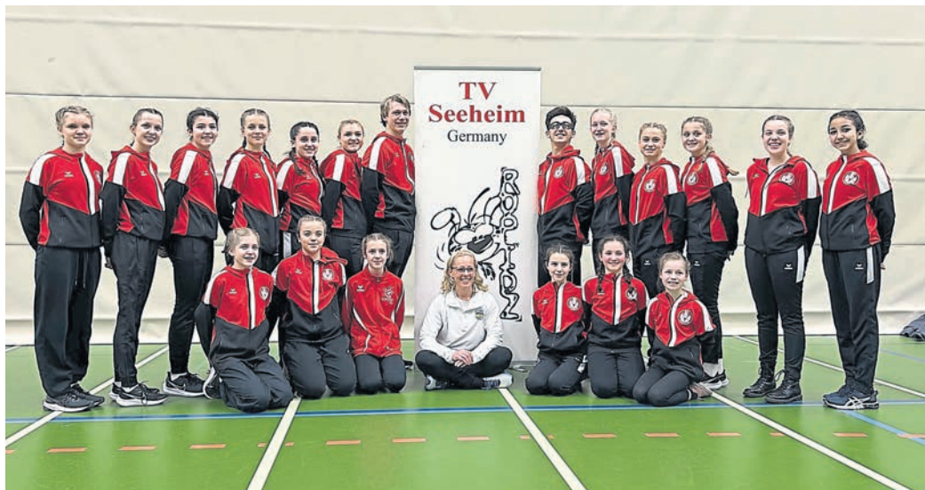
Die Rope Skipperinnen und -skipper vom TVS nahmen erfolgreich an den Hessen-Meisterschaften teil.