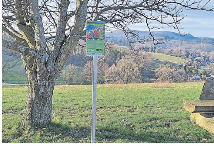
Mehlsbeere mit Ausblick – der Baum des Jahres 2024 in Ober-Beerbach.

Der VV hat in Ober-Beerbach einen Baum-des-Jahres-Weg angelegt, konnte hierbei aber bereits auf Pflanzungen zurückgreifen, die seit 1989 auf einem vom Verein angelegten Panorama-Weg erfolgten.