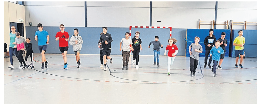
Der Tischtennis-Nachwuchs des TVS beim Aufwärmtraining in der Turnhalle der Tannbergsschule.