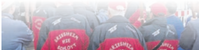
Der TuS stürmte das Rathaus. Doch mit so viel Gegenwehr hatten sie nicht gerechnet.

Doch die heranstürmenden Narren konnten sie nicht lange aufhalten, auch wenn sie all ihre Kräfte aufwendeten. Mit vereinten Kräften stürmten die Fastnachter die Treppe hinauf, kletterten über das Treppengeländer, am Bürgermeister vorbei, hoch in den ersten Stock und präsentierten sich dort stolz auf dem Rathausbal-