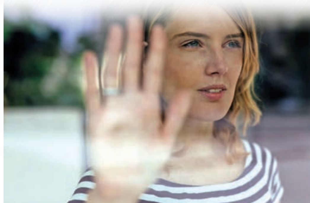
Die raumseitige Scheibenoberfläche von Wärmedämmglas bleibt stets nahe der Raumtemperatur, sodass kalte Fallwinde in Fensternähe reduziert werden – ein entscheidendes Kriterium für Behaglichkeit.

(akz-o). Das Gefühl der Behaglichkeit ist eine subjektive Wahrnehmung, die von zahlreichen Faktoren abhängig ist. Dazu gehört in geschlossenen Räumen vor allem die thermische Behaglichkeit durch die Raumlufttemperatur, die Temperatur der Oberflächen und Umschließungsflächen, die Intensität von Luftbewegungen und eine gesunde relative Luftfeuchtigkeit von 40 bis 60 Prozent. Besonders im Winter ist die „gefühlte Raumtemperatur“ entscheidend für Behaglichkeit. Zu hohe Luftfeuchtigkeit kann hingegen auf Dauer Schimmelbildung verursachen, während zu niedrige Luftfeuchtigkeit zur Austrocknung der Schleimhäute führt und diese anfällig für Krankheiten werden. Heimelig wird es, wenn neben der Raumluft auch die Wände,