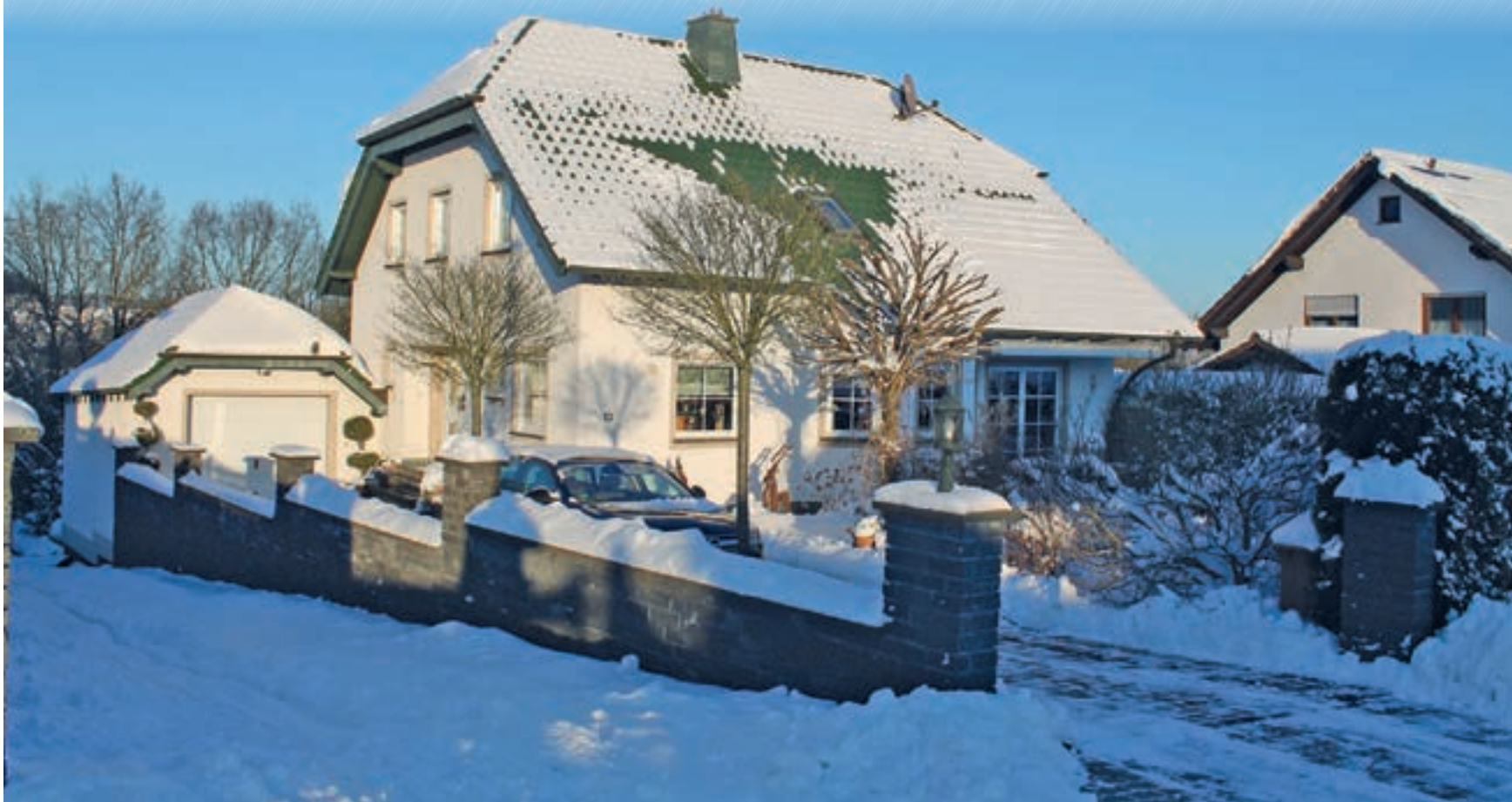
Dächer werden durch vielfältige Witterungen und Temperaturunterschiede beansprucht. Ein regelmäßiger Check sorgt für Sicherheit.