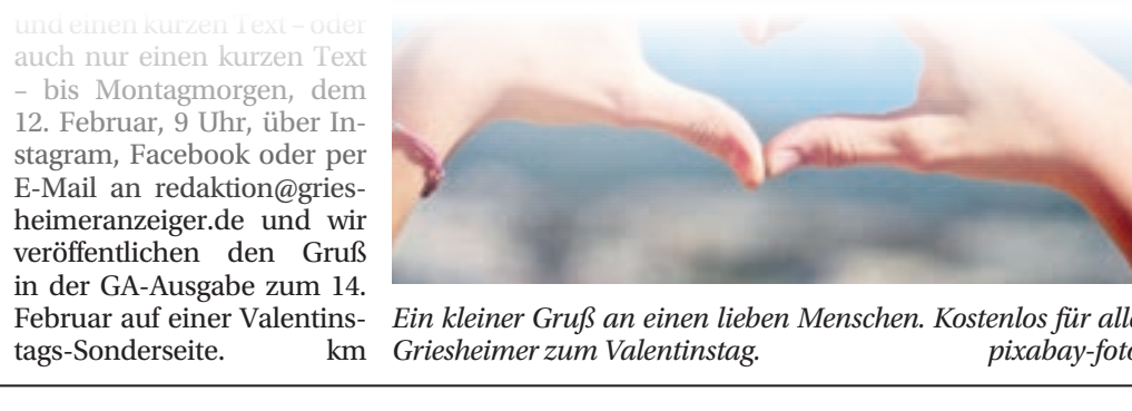
Ein kleiner Gruß an einen lieben Menschen. Kostenlos für alle Griesheimer zum Valentinstag.