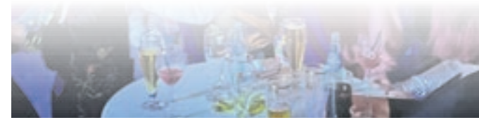
Eine Polonaise mit dem Bürgermeister durch den großen Saal des Zöllerrhannes wird es in diesem Jahr nicht geben.

Im vergangenen Jahr wurde die Rosenmontagsveranstaltung sehr gut angenommen, viele verkleidete Griesheimer tanzten und feierten ausgelassen im großen Saal des Zöllerrhannes bis spät in die Nacht, zogen in einer Polonaise, gemeinsam mit dem Bürgermeister, durch die Reihen und sangen altbekannte Lieder und aktuelle Hits textsicher mit. Doch in diesem Jahr sei die Ticket-Nachfrage um einiges geringer gewesen. „Wir hatten uns sehr darauf gefreut, mit den Griesheimern den Rosen-