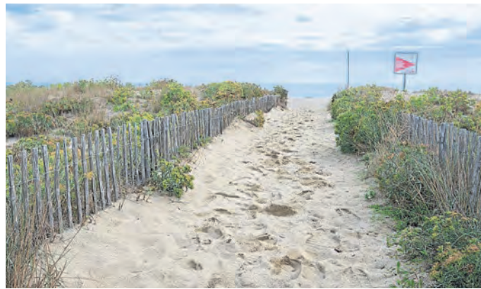
Links: Die Zugänge zum Strand Saint-Cyprien Plage. Rechts: Die alte Burg Château de Quéribus.