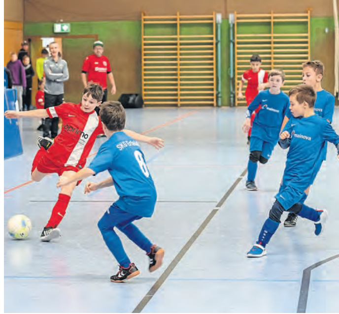
Erfelden/Ried (sh). Am vorvergangenen Wochenende fand in der Großsporthalle in Erfelden der Ried-Cup der E-Jugendmannschaften 2023 statt. Insgesamt acht Teams aus dem Ried traten in zwei Gruppen gegeneinander an. Gespielt wurde 15 Minuten pro Partie. Im Finale standen sich die Mannschaft des FC Germania Leeheim und der SKG Erfelden A gegenüber. Da in der regulären Spielzeit keine Treffer fielen, ging es in die Verlängerung. Am Ende hatten die Germanen das bessere Ende für sich und konnten den 1:0-Siegtreffer erzielen.