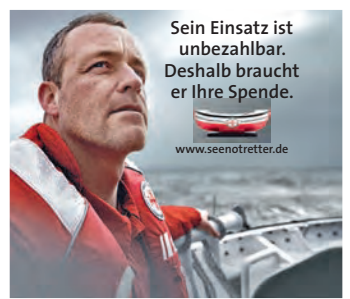
Sein Einsatz ist unbezahlbar. Deshalb braucht er Ihre Spende. www.seenotretter.de

Stockstadt/Region (red). Seit einigen Wochen führt der Rhein wieder deutlich mehr Wasser, was auch zu einem Ansteigen des flussnahen Grundwassers und zu Überflutungen einiger Waldflächen im Naturschutzgebiet Kühkopf-Knoblochsaue geführt hat. Infolge des nun aufgeweichten Bodens sei, laut dem Forstamt Groß-Gerau, derzeit vermehrt mit umstürzenden Bäumen zu rechnen. Aufgrund der nassen Wege im Gebiet könnten diese auch bis auf Weiteres nicht befahren und geräumt werden, sodass sich teils erhebliche Einschränkungen ergeben könnten. Das Forstamt Groß-Gerau rät insbesondere bei starkem Wind bis auf Weiteres dringend davon ab, in den Waldflächen des Naturschutzgebietes spazieren zu gehen.