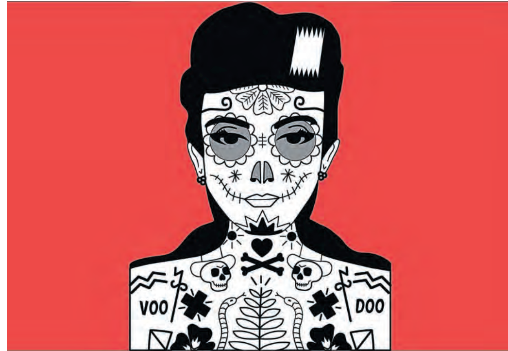
Voodoo war gestern, heute lässt sich nahezu präzise bestimmen, was wahrscheinlich in der regionalen Zukunft passieren wird.

halten ein Fahrverbot, da sie nicht dem neuen hessischen Leitkulturweltbild nach Vorbild von 1984 entsprechen. Deswegen muss das Euler-Flugfeld nun perspektivisch für den Bau des Frankfurter Terminal 6 bereitgehalten werden. Wenige Tage später kommt heraus, dass Pfungstadt sich hinter verschlossenen Türen ebenfalls für einen Flughafen auf freien Gewerflächen beworben hatte. Man versprach sich davon einen Imagegewinn.