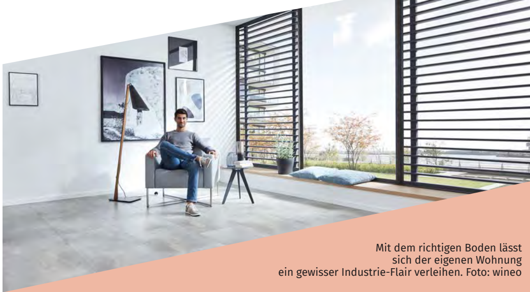
Mit dem richtigen Boden lässt sich der eigenen Wohnung ein gewisser Industrie-Flair verleihen. Foto: wineo

(pr-jaeger) Alte Fabriken haben ein ganz besonderes Flair: Unverputzte Backsteinwände, riesige Fenster und ein großzügiges Wohngefühl machen den Charme der Industriehallen aus, die sich perfekt zu Loft-Wohnungen umgestalten lassen. Die Aufteilungen inspirieren Bauherren und Architekten zu weitläufigen Planungen, die sich in der Regel von der klassischen Aufteilung Wohnzimmer – Küche – Bad lösen. Wenn es darum geht, diesen Vintage-Look in einstige Fabrikgemäuer oder offen geschnittene Loft-Wohnungen zu zaubern, spielen die Bodenbeläge eine zentrale Rolle.