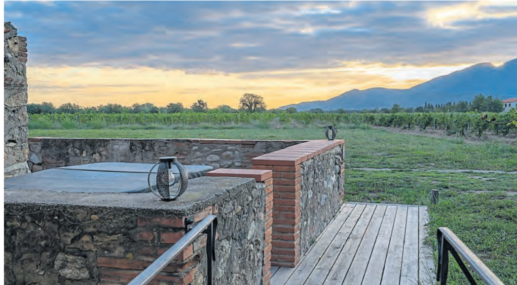
Ein Blick von der Unterkunft in Céret auf die Pyrenäen.

Bevor es aber auf die Insel gehen sollte, machten wir einen Stopp in Südfrankreich am Fuße der Pyrenäen. Ein wenig skeptisch ging ich die erste Urlaubswoche in Frankreich an, da ich mit diesem Land bisher nicht die allerbesten Erfahrungen gemacht hatte und wie sollte es auch anders sein, fing der Tag in Frank- reich direkt wie erwartet an. Die erste Tankstelle und wie schon so oft weigerte sich der Zapfsäulenautomat vernünf- tig mit uns zu kommunizieren. Er wollte unsere Kreditkarten nicht annehmen. Nach mehr- eren Versuchen schafften wir es endlich, dass der Auto- mat eine unserer Karten dann doch akzeptierte und wir unsere Fahrt fortsetzen konn- ten. Glücklicherweise blieben dieser und ein weiterer Tank- stopp die einzigen negative Ereignisse im Zusammen- hang mit Frankreich. Unser Ziel war ein Weingut in Céret nahe der spanischen Grenze.