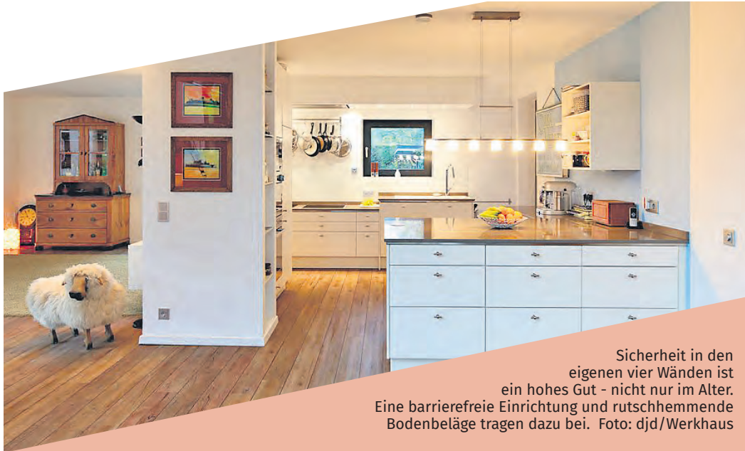
Sicherheit in den eigenen vier Wänden ist ein hohes Gut – nicht nur im Alter. Eine barrierefreie Einrichtung und rutschhemmende Bodenbeläge tragen dazu bei.

(djd). Sicherheit, altersgerechtes Wohnen und eine barrierefreie Ausstattung – diese Wohnwünsche stehen laut Statista bei Menschen über 50 hoch im Kurs. Viele wollen frühzeitig für das Alter vorsorgen und ihr Zuhause so einrichten, dass sie später selbst bei eingeschränkter Beweglichkeit den Alltag noch selbstständig gestalten können. Dabei ist Barrierefreiheit keineswegs eine Frage des Alters: Das Beseitigen oder Vermeiden von Stolperfallen bedeutet mehr Sicherheit und Komfort in jeder Lebensphase, beispielsweise für Familien mit Kindern.