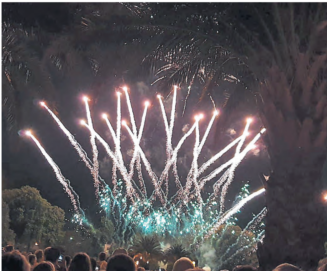
Glitzernde, strahlende, bunte Raketen erleuchten traditionell den Himmel in der ersten Nacht eines jeden neuen Jahres und werden von den Menschen an Silvester bestaunt.

Region (hst). Am 31. Dezember, in der Nacht auf den 1. Januar, feiern die Menschen und lassen - sofern es wieder erlaubt ist - Raketen steigen und laute Böller krachen. Diese Sitte hat ihren Ursprung wohl in heidnischen Zeiten, in denen die Germanen mit lautem Getöse und Feuerwerk die bösen Geister des ausgehenden Jahres vertreiben zu können. Sie schlugen auf Töpfe, ließen unentwegt Glocken läuten und zündeten Holzräder an, die sie brennend ins Tal rollten, so der Volksglaube. Heutzutage feiern die Menschen in Deutschland Silvester - Namensgeber dafür war später dann allerdings ein Christ, nämlich Papst Silvester der Erste, der am 31. Dezember 335 starb - in einer moderneren Form, aber immer noch laut, mit viel Spektakel am Himmel und jeder Menge guter Vorsätze im Gepäck. Was den Menschen eine Freude ist für die meisten Tiere ein Alptraum. Jährlich suchen dutzende Hunde und Katzen aus lauter Panik we-