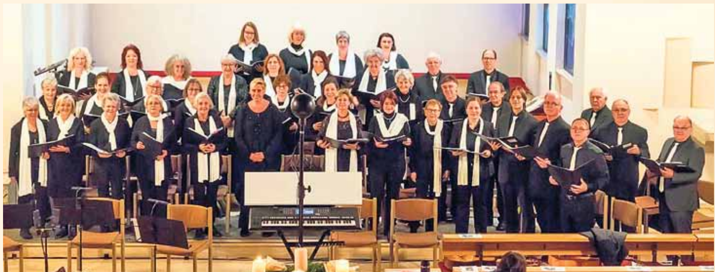
Der Kirchenchor St. Stephan beteiligt sich in der Heiligen Nacht um 22 Uhr an der Christmette in der St. Stephanskirche. In der Vorweihnachtszeit beteiligt sich der Chor am zweiten und vierten Advent musikalisch auch an den Gottesdiensten in der St. Stephanskirche.