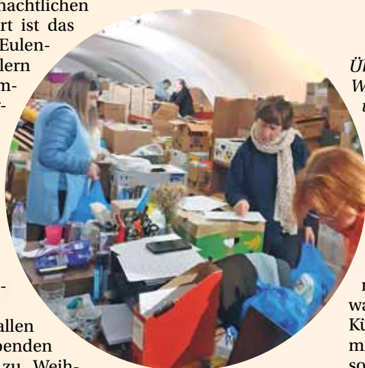
Ehrenamtliche Helferinnen bei der Sortierung der Hilfsgüter des PDUM im Hilfszentrum „Eulennest“ in Uzhgorod. privat-foto

bedarf für die Kinder oder Kaffee, Tee und Kakao für erwachsene Empfänger. Eine deutliche Beschriftung, bei Kindern etwa, ob das Päckchen für einen Jungen oder ein Mädchen bestimmt ist, und für welches Alter die Geschenke geeignet sind, sorgen dafür, dass die Gaben in die richtigen Hände