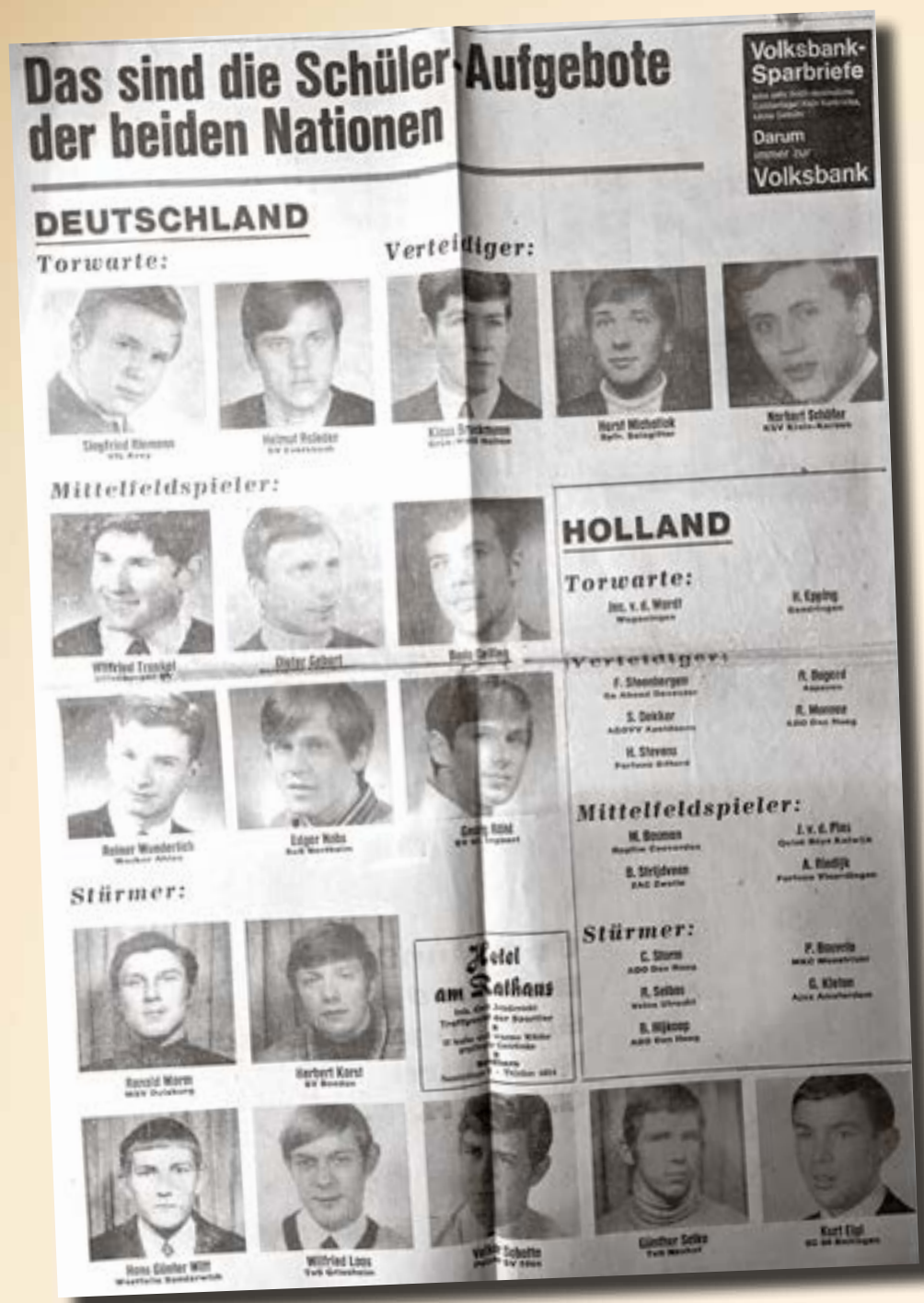
Für die Aufstellung der beiden Mannschaften hatte die Zeitung „Grafschafter Nachrichten“ eine komplette Seite reserviert. Die Zeitung erscheint im Grenzgebiet zu den Niederlanden in der Grafschaft Bentheim, in Teilen des Emslandes und den Niederlanden.