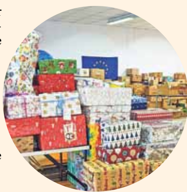
Über 200 schön verpackte Weihnachtspäckchen wurden bereits im Sachspenden-Depot des PDUM abgegeben.

Der letzte Transport mit Hilfsgütern hat Griesheim am 21. November verlassen. Wie Ehry berichtet, haben die ehrenamtlichen Helfer des Vereins knapp tausend Umzugskartons, Plastiksäcke,