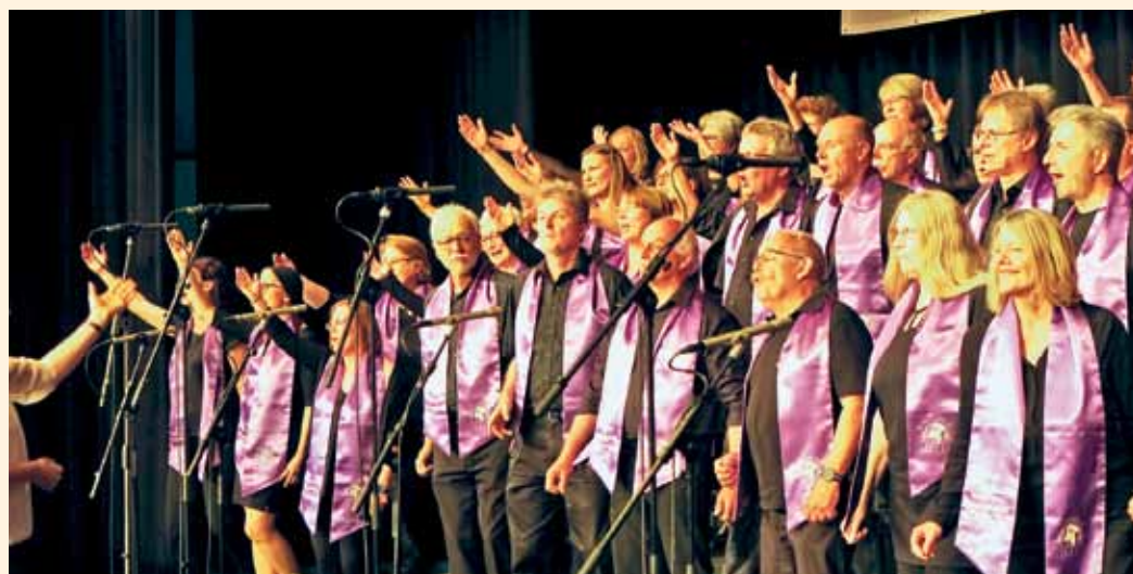
Der Gospelchor Rise-Up begleitet den Gottesdienst in der Lutherkirche am zweiten Weihnachtsfeiertag, um 9.30 Uhr.

Die Interessengemeinschaft der Griesheimer Gartenbahner (IGG) lädt in Kooperation mit dem Haus Waldeck an Heiligabend, von 11 bis 16 Uhr, zu einem Sonderfahrttag auf dem Vereinsgelände vor dem Haus Waldeck ein. Um den Besuchern die Zeit bis zur Bescherung zu verkürzen, fahren verschiedene Züge, manche beladen mit Weihnachtsgebäck. Kinder dürfen an diesem Tag auch selbst die Steuerung der Lokomotiven übernehmen. Für das leibliche Wohl der Eltern wird unter anderem heißer Glühwein angeboten, die Bewirtung der Gäste übernimmt das Team vom Caféhaus Waldeck. Bei Regen fällt die Veranstaltung aus.