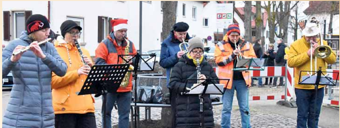
Mitglieder des Blasmusikvereins beim Weihnachtsblasen am Kreuz im vergangenen Jahr.