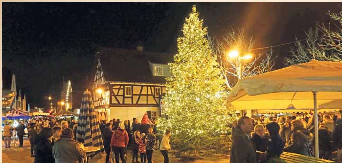
Der geschmückte Weihnachtsbaum auf dem Jean-Bernard-Platz Am Kreuz beim Weihnachtsmarkt 2018. Dort wird er auch in diesem Jahr wieder leuchten.