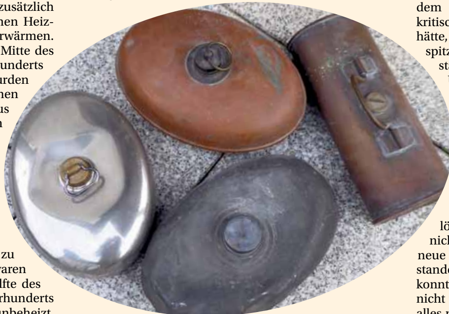
Einst heiß begehrt, heute Museumsstücke. Der Museumsverein hat die verschiedensten Modelle alter Wärmflaschen in seinem Besitz.

Dazu kam es allerdings nicht! Eine gute Freundin gab meiner Großmutter einen heißen Tipp. Die alte Dame füllte erhitzten Sand in ihre Bettflasche. Der rann nicht durch die feinen Löcher. Trotzdem leistete die Bettflasche weiterhin dieselben guten Dienste wie zuvor mit Wasser gefüllt. Heiligabend war gerettet.