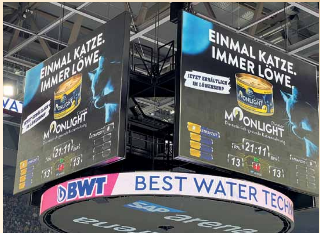
Einmal Katze, immer Löwe. Mit diesem Slogan wirbt „Moonlight Dinner“ bei den Rhein-Neckar-Löwen in der SAP-Arena in Mannheim.