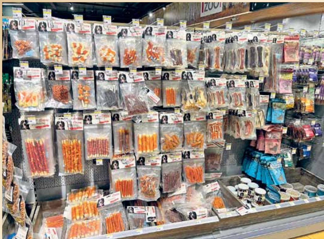
Snacks von Corwex sind besonders hochwertige Leckerli für Hunde. Sie werden in vielen Variationen angeboten.