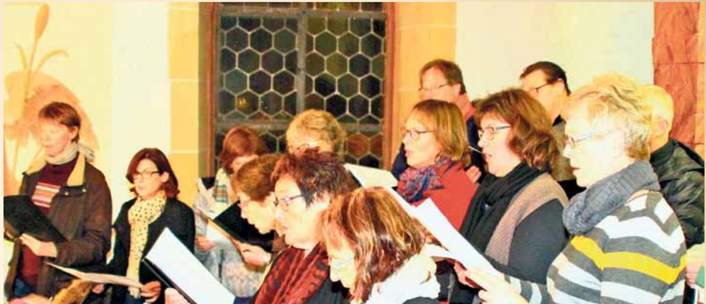
Der Cantamus-Chor der Luthergemeinde begleitet in diesem Jahr die Christmette am Heiligen Abend um 22.30 Uhr in der Lutherkirche.