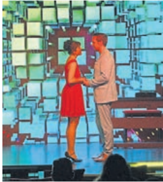
Herzschmerz auf der Titanic, das gibt es auch in Weiterstadt i Stein's Tivoli Theater im Loop5.

Das Theater feierte seine Eröffnung mit der Weltpremiere des neuen Comedy Musicals „Happy Titanic“: „Checken Sie ein auf dem brandneuen Kreuzfahrtschiff ‚Happy Titanic‘ und kom-