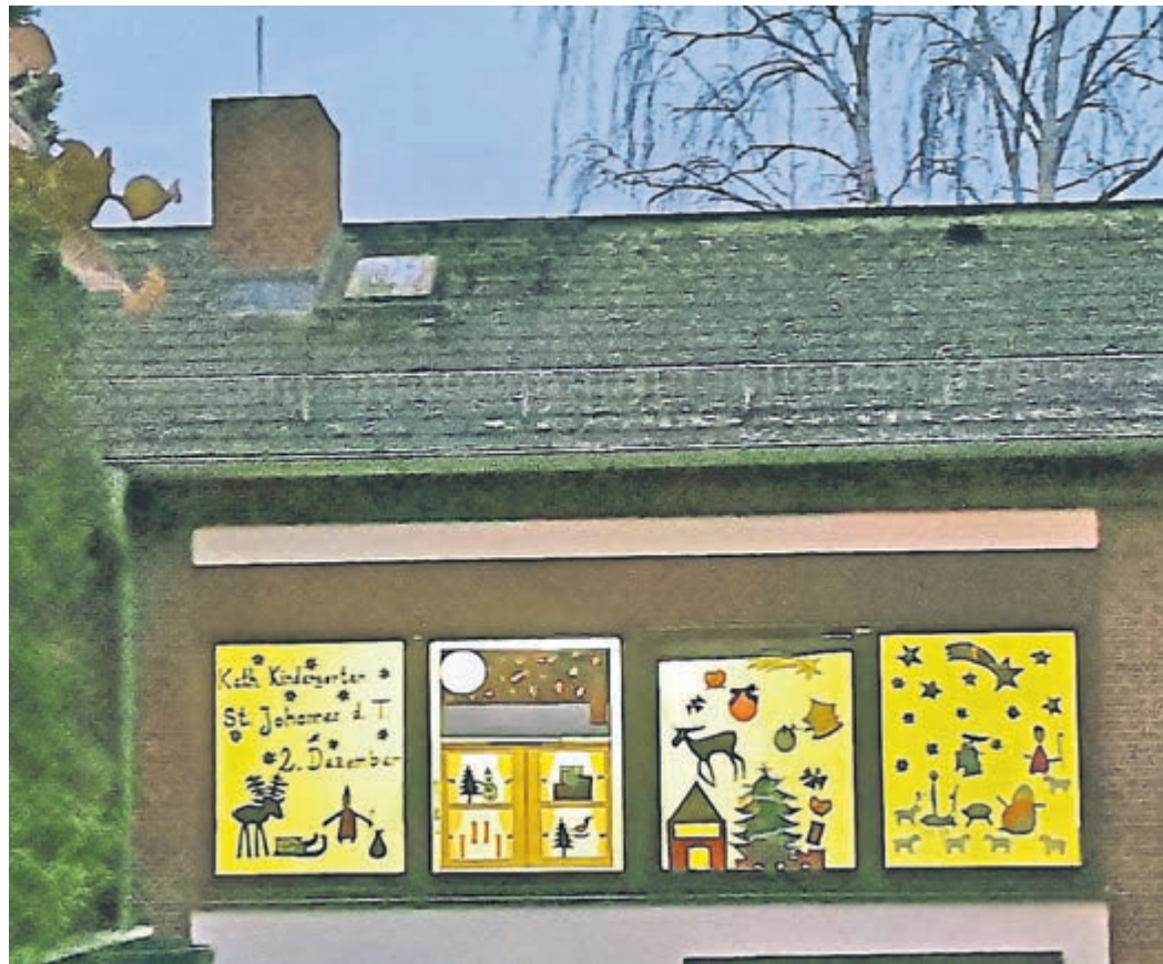
Der Kindergarten der katholischen Pfarrgemeinde St. Johannes der Täufer beteiligt sich schon viele Jahre beim Lebendigen Adventskalender – in diesem Jahr am 18. Dezember.

„Was ist eigentlich die Adventszeit?“, fragen sich viele Menschen heutzutage, denn der Ursprung vieler Feiertage und christlicher Feste ist im Laufe der Jahre bei manchen in Vergessenheit geraten. „Advent ist aus dem lateinischen ‚adventus‘ abgeleitet und wird mit ‚Ankunft übersetzt‘, teilt die evangelische Kirchengemeinde Weiterstadt mit, und ergänzt: „Nicht nur, dass jeden Tag eine andere Familie, Verein oder Institution auf die Ankunft von Besuchern wartet, nein, wir alle warten auch auf Weihnachten und feiern die Geburt Jesu Christi. In seinem Namen versammeln sich seit über 2000 Jahren Menschen, und so ist