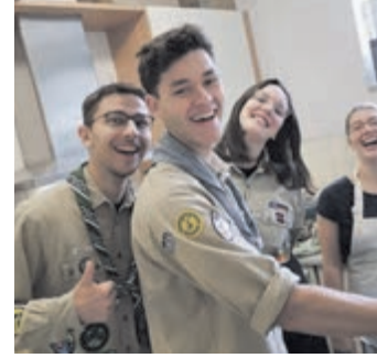
Warten auf die Gäste: Pfadfinder in der Kirchenküche.

Weiterstadt (ml). Am 3. Dezember kann mittags die Küche kalt bleiben, heißt es in einer Mitteilung der Pfarrgemeinde St. Johannes der Täufer: „Seit Jahrzehnten startet die katholische Kirchengemeinde mit einem gemütlichen Essen im liebevoll gedeckten Gemeindezentrum in den Advent. Bis 2021 waren die Altver (ältere Pfadfinder) dafür verantwortlich und haben viele Spenden den unterschiedlichsten guten Zwecken zugeführt. 2022 haben die Pfadfinder die Töpfe übernommen und laden zum traditionellen Adventessen ein. Lassen Sie sich diese Gelegenheit nicht entgehen, nach dem Gottesdienst, so gegen 12 Uhr mittags, in geselliger Runde beisammenzusitzen und gutes Essen zu genießen! Karten für leckeres Chili für sieben Euro oder Kartoffelsuppe für sechs Euro gibt es im Vorverkauf vor und nach den Gottesdiensten. Der Erlös wird in diesem Jahr für die Zeltlager und Gruppenstunden verwendet.“