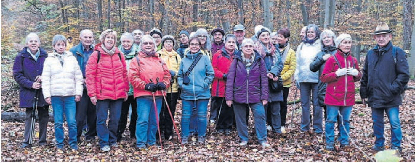
Mit fröhlichen Liedern unterwegs: Die SKG Wandergruppe erfuhr bei ihrer Wanderung zur Dianaburg viel über die Geschichte des ehemaligen barocken Jagdschlusses.