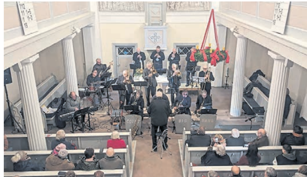
Traditionell im Advent lädt die Count City Big Band des Musikvereins Gräfenhausen zu einem Swing-Konzert in die evangelische Kirche Gräfenhausen ein.

Count City Big Band spielt wieder in der Kirche