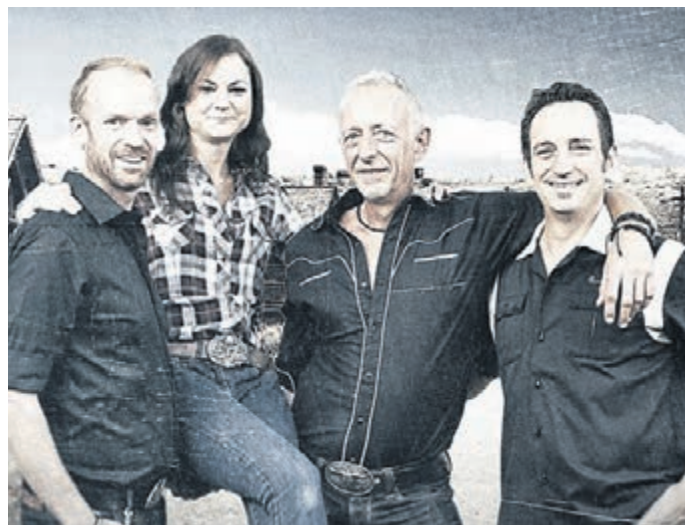
Die Band „Cash Fellows“ spielt Country Music von Johnny Cash bis zu Reinhard Mey. Im Kulturbahnhof sind sie am 1. Dezember zu Gast.

Weiterstadt (red). Country Music im Kulturbahnhof Weiterstadt mit „Cash Fellows“. Die vierköpfige Band spielt nicht nur Songs von Johnny Cash über Willie Nelson bis Simon and Garfunkel, sondern hat auch deutsche Lieder von beispielsweise dem Liedermacher Reinhard Mey dabei. Die Gäste erwarten am Freitag, dem 1. Dezember, ab 20 Uhr, ein rundum gelungener County-Abend, bei dem mitgeklatscht und auch mitgesungen werden darf. Einlass ist um 19 Uhr, Beginn um 20 Uhr. Der Eintritt ist frei, und wie bei freiem Eintritt im Kuba üblich, geht der Hut run.