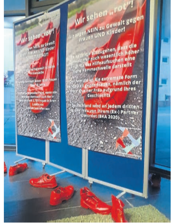
„Femizid“: Wie das Bundeskriminalamt ermittelt hat, wurde im Jahr 2020 in Deutschland an jedem dritten Tag eine Frau von ihrem Ex-Partner ermordet. Die Plakatausstellung im Medienschiiff zeigt eindringlich, wie aktuell Gewalt an Mädchen und Frauen immer noch ist.

Neben der Sensibilisierung dieses immer noch aktuellen Themas will das Bündnis „Weiterstadt Wirkt“ auch Spenden sammeln für ein