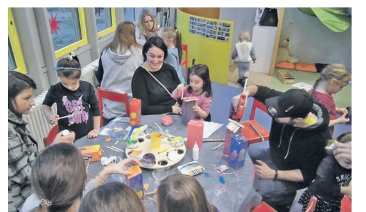
Pfungstadt (red). Das Kinder- und Familienzentrum BimBamBino bot kürzlich einen Bastelnachmittag für die Eltern an. Aus alten Milchtüten und verschiedenen Materialien entstanden dabei Futterstellen für Vögel.