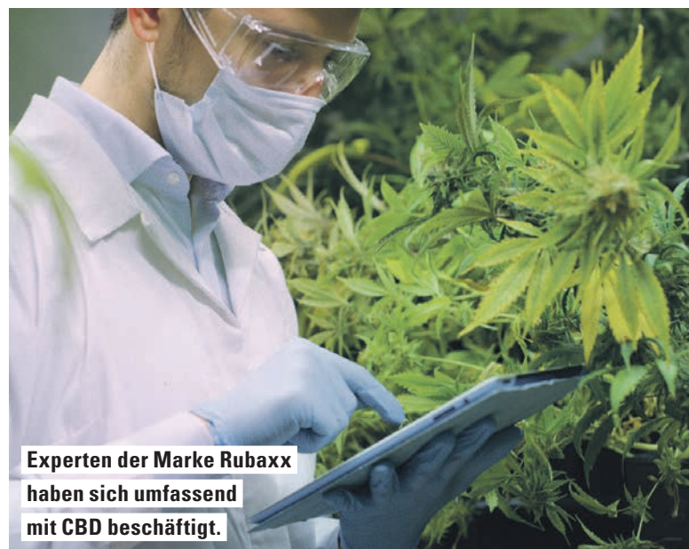
Experten der Marke Rubaxx haben sich umfassend mit CBD beschäftigt.