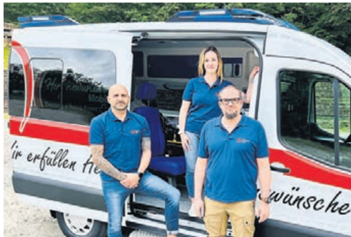
Der DRK-Kreisverband Bergstraße hat gemeinsam mit den DRK Kreisverbänden Dieburg und Odenwaldkreis ein „Herzenswunsch-Mobil“ eingerichtet.

„Auf den ersten Blick ähnelt der Transporter sehr einem gewöhnlichen Einsatzfahrzeug, verfügt der Krankentransportwagen doch neben der typischen farblichen Gestaltung der Karosserie auch über Sondersignale auf dem Dach“, so die Verantwortlichen des DRK. Da das Herzenswunsch-Mobil jedoch für ein Reisen unter speziellen