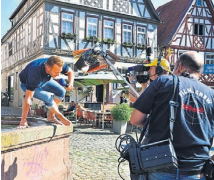
Voller Einsatz fürs Fernsehen: hr-Moderator Jens Pflüger und das Hessenschau-Filmteam beim Live-Dreh am vergangenen Donnerstag.

Heppenheim (gp). Von Mittwoch bis Samstag fanden die 30. Gassensensationen in der Altstadt statt. Anlässlich dieses Jubiläums des Internationalen Straßentheaterfestivals sendete die „Hessenschau“ am Donnerstagabend live aus Heppenheim. Zuvor gewährte das hr-Team der Presse einige Backstage-Einblicke in unterschiedliche Arbeitsbereiche sowie auch in die Live-Aufnahmen der Sendungsbeiträge.