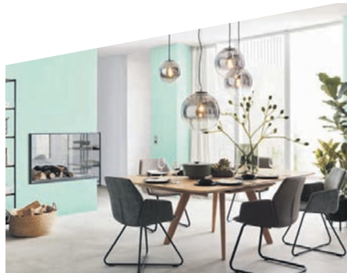
Wandfarben prägen entscheidend die Atmosphäre des Zuhauses und bringen gleichzeitig den persönlichen Stil der Bewohner zum Ausdruck.

(red). Blau beruhigt, Rot und Orange regen an, Gelb macht munter und Grün vermittelt ein Gefühl der Geborgenheit. Farben und ihre Wirkungen auf die Psyche des Menschen werden seit Langem erforscht. Die unterschiedlichen Töne können Stimmungen hervorrufen oder verstärken, indem sie das Unterbewusstsein ansprechen. Neben den allgemein gültigen Wirkungen, die den verschiedenen Farben nach wissenschaftlichen Untersuchungen zugesprochen werden, kommt es aber ebenso sehr auf den persönlichen Geschmack an. Ganz besonders gilt das für die eigenen vier Wände als privaten Erholungs- und Rückzugsort. Weiß als alleinige Wandfarbe ist vielen auf Dauer doch zu monoton - farbige Wände hingegen bringen Lebendigkeit ins Zuhause und spiegeln den individuellen Einrichtungsstil wider. Für eine frische und aktivierende Stimmung sorgen helle Farben - sie sind damit eine gute Wahl beispielsweise für das Wohlfühlbad oder die Küche. Kräftige Farben setzen auffällige Akzente, gerne auch als Kontrast zu einer ansonsten eher zurückhaltenden Gestaltung. Eher dunkle Töne wiederum vermitteln Geborgenheit und Wärme, damit sind sie insbesondere für Schlafräume beliebt. Und wer