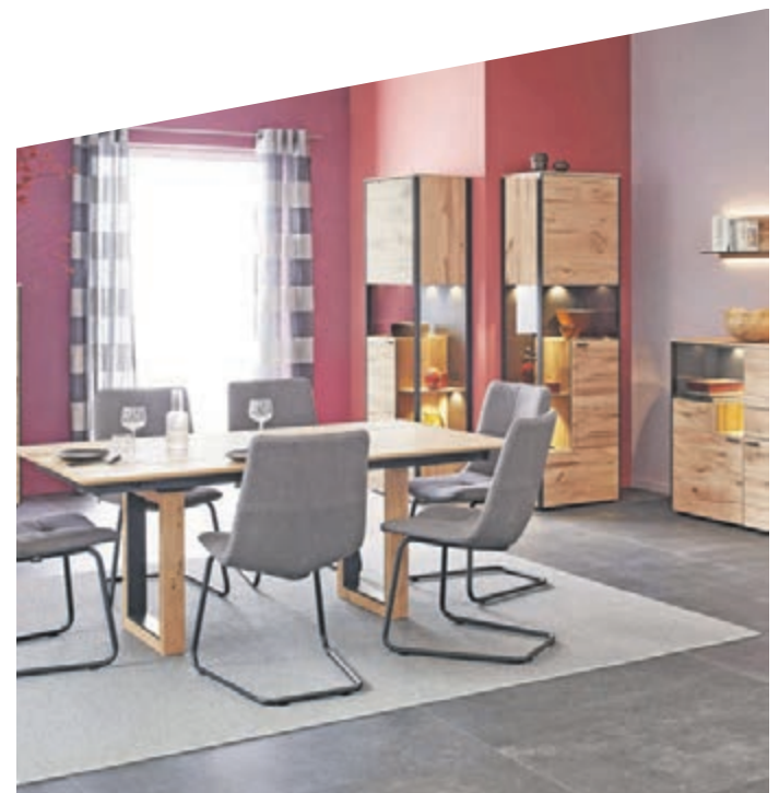
Der Mix aus verschiedenen Farben für Wände und Boden lässt einen Raum erst lebendig erscheinen.

Während zum Beispiel Platingrau kraftvoll und klar wirkt, bringt das heitere Sonnen-gelb den Raum zum Leuchten.