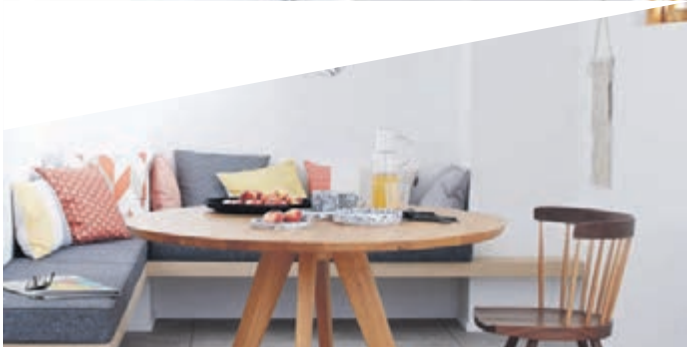
Nicht nur im Koch- und Essbereich ist Weiß die Farbe der Wahl.

(red). Es gibt Klassiker, die immer beliebt bleiben. Weiß gestrichene Wände gehören dazu: Laut Statista ist jede zweite Küche in Deutschland in dieser Farbe gestrichen, auch jedes dritte Schlafzimmer und jedes vierte Wohnzimmer trägt Weiß. Das hat viele Gründe. Der helle Ton lässt Räume großzügiger und freundlicher erscheinen, selbst knapp geschnittene Zimmer wirken auf diese Weise größer. Zudem passt die Farbe zu den verschiedensten Einrichtungsstilen und lässt sich beliebig mit Bodenbelägen oder Heimtextilien und Dekoartikeln kombinieren. Zudem steht Weiß für Sauberkeit und eine frische, hygienisch saubere Raumatmosphäre. Dieser Raumeffekt lässt sich einfach und zeitsparend erzielen. Ein neuer Anstrich macht kaum Mühe, ist eigenhändig zu bewerkstelligen und führt zu einer direkt sichtbaren Verschönerung des Zuhauses. Voraussetzung für überzeugende Resultate ist eine gute Vorbereitung. So sollte der Untergrund gut gesäubert, trocken und staubfrei sein. Auch